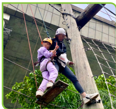
在繩網上，同行的親人成為了彼此的好伙伴。