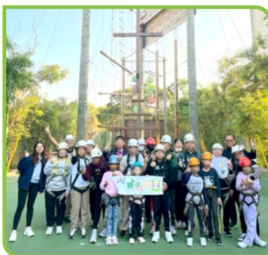
參加者跟同工在高空繩網前來一張大合照。