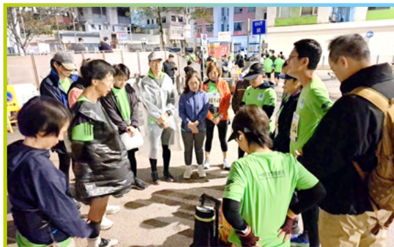
渣馬活動當天還未亮，跑手們在起跑前一起禱告。