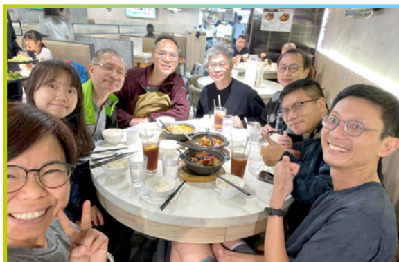
練跑活動後，跑手們會一同吃晚餐，交流心得。