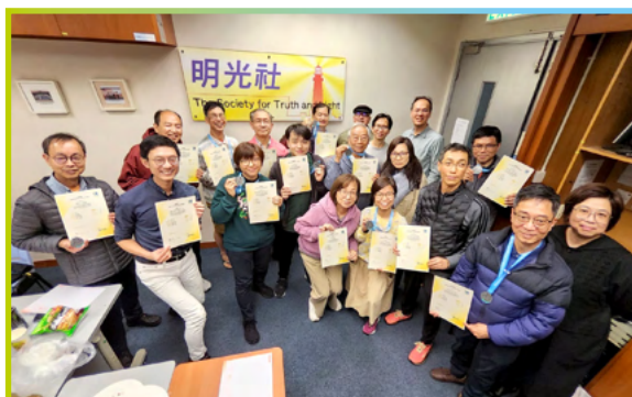
在感恩聚餐期間，跑手們齊齊展示自己的成績證書。