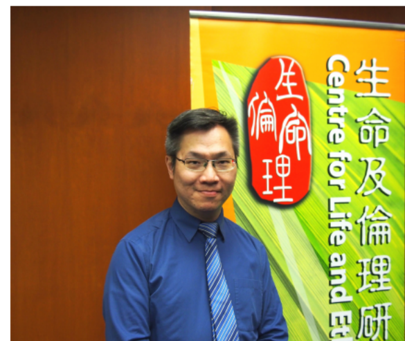
彭博士提醒我們要多方面地聆聽，尋求神在這世界所定的旨意。

彭博士相信梅頓提醒我們，當我們遇到某些人和事，或是要付諸實行某些工作，都要常常尋求能否符合「神的道」(logos) 或真理，又或是否合乎神所賦予我們的本質。默觀者無論是順服或是放棄神的旨意，都不應該對人的生命或工作本身漠不關心，因為無論人或工作本身都有神所賦予的價值。「漠不關心」(insensitivity) 不應與「抽離」(detachment) 混為一談。梅頓指出「默觀者必須要抽離，但永不可以容讓自己對於真正的人類價值漠不關心，這無論是在社會上，在其他人身，或是在自己身上，也當如此。」事實上，通過聆聽別人的痛苦、別人的需要，憐憫他人，人才能聆聽到神。