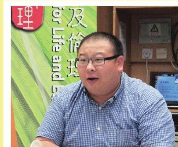
陳博士指出资本主義當初被提出時，其實是帶有不少基督教信仰的元素。

或許有人會說，香港是個資本主義城市，我們奉行自由經濟，地產商也只是「做生意」，想賺錢並沒有錯。況且他們所作的，頂多只是遊走於法律的灰色地帶，也不是犯法行為云云。是的，香港的確是一個資本主義的社會，以商業掛帥無可厚