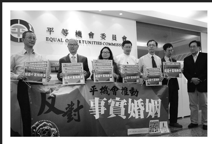
明光社於10月28日向平機會主席周一嶽醫生遞交收集到超過十萬個聯署。

平等機會委員會於今年7月推出《歧視條例檢討》公眾諮詢文件，諮詢期今日屆滿。平機會提出77條歧視條例檢討諮詢問題，希望檢討現時四條歧視法，卻暗度陳倉將「事實婚姻關係」放入條文中，我們對有關建議表示極度憂慮。