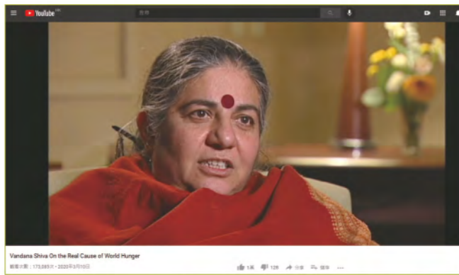
跨學科領域的環境農業倫理學家Vandana Shiva。

種植基改食物無疑是透支人類的未來，因為許多基改農場不輪耕，不讓土地有休息的機會，這些農場也不在乎土壤有沒有養分。阿根廷聖塔菲省的農業學家