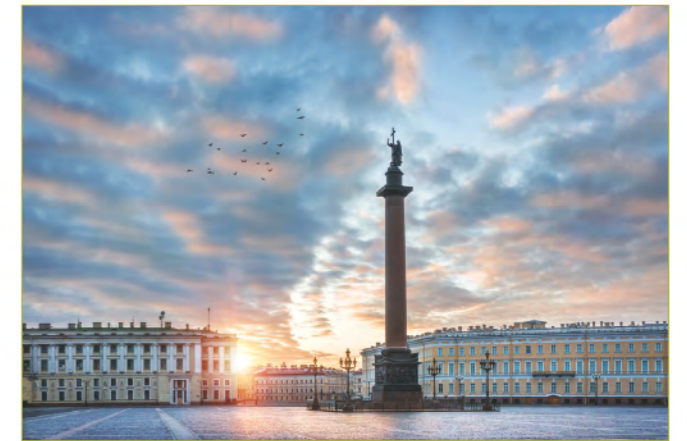
曾經有科學家拼死在列寧格勒（現稱聖彼得堡）保護糧食種子，圖為聖彼得堡今貌。

很多人都以為斯瓦爾巴全球種子庫是全球首個種子銀行，其實最早提出種子銀行概念的人是前蘇聯遺傳學家和植物學家Nikolai Vavilov，他用了近二十年的時間走遍五大洲五十多個國家收集不同種類的野生作物種子，把它們存放在巴甫洛夫斯克，只是這些農作物種子並不是單純的用作儲存，也會用於研究遺傳學和雜交育種，有助解決人類飢餓問題。1941年，Vavilov因被人陷害而被判死刑，他當時被關押在薩拉托夫一號的死囚牢房中，德國納粹軍揚言要剷平當時的列寧格勒（現稱聖彼得堡），科學家和學生等人冒死把種子等農作物從靠近前線的巴甫洛夫斯克，轉移到列寧格勒中心的植物工業學院地下室，並且逝世保護它們。為了避免Vavilov千辛萬苦找來的植物物種被納粹軍人摧毀或掠奪，又或是被當時因戰爭而捱餓的列寧格勒飢民爭奪，Vavilov的追隨者寧死也要守護這一批數噸重的糧食種子，他們的目的只有一個，便是著眼於未來，希望未來的蘇聯人民可以吃得飽。他們絕對不是沒有憐憫之心，罔顧眼前飢民的需要，只是為了更宏大的理想，連他們自己（至少有九人），寧願選擇餓死在幾千包大米旁邊，也不願意對植物種子打主意。Vavilov及跟他志同道合的夥伴雖然俱往矣，但他們當日的犧牲並沒有白費，現今俄羅斯種植的黑加侖深受歐洲人喜愛，有超過一半的黑加侖品種是源於