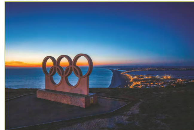
位於英國的奧運五環紀念碑。

奧林匹克五環（The Olympic Rings）由五個互相扣連的環圈組成，它們的顏色為藍、黃、黑、綠、紅，它是由Coubertin於1913年設計，按他所述，這五個環代表著世界的五個部份。過去有不少資料指奧運五環分別象徵著五大洲，即：藍色代表歐洲；黑色代表非洲；紅色代表美洲；黃色代表亞洲；綠色代表大洋洲。其實這是沒有根據的——起碼Coubertin在創作五環時並沒有說過這個意思，很可能是大家想當然以為是這樣。 3 這樣因顏色引發的小誤會，本來無傷大雅，但在今屆奧運，香港隊因為球員球衣的問題而鬧出風