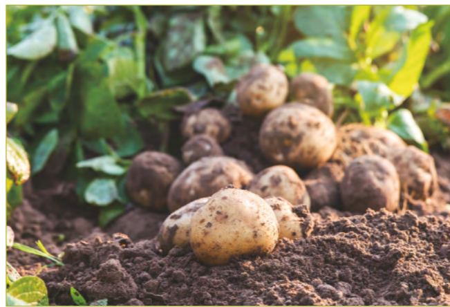
愛爾蘭人的主要糧食馬鈴薯染病曾引發大饑荒。

害怕失去農作物的恐懼並不是無的放矢，歷史上便曾爆發過愛爾蘭大饑荒，災難源於愛爾蘭人作為主食的馬鈴薯出現了大規模病害，馬鈴薯感染了致病疫霉（ Phytophthora infestans ）之後，收成銳減，大饑荒更導致當時的人口削減了近四分之一。 1 為了未雨綢繆，截至2020年，全球有近2,000間種子銀行。種子銀行的建立，目的便是要保存種子，以致當人類面對毀滅性的災難，如戰爭、瘟疫、以及氣候變化，仍然可以耕種出可持續發展並且多樣性的農作物。多樣性的農作物對人類的未來非常重要，因此種子銀行可以肩負起保存大量農作物的野生近緣種的責任，以達到保護物種多樣性和搶救野生作物資源。 2