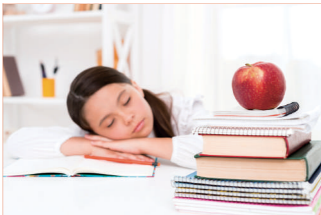
有調查發現本港小學生的睡眠時間不足。

父母大都疼愛自己的子女，當條件許可，絕大部份的父母都會為子女獻上最好的，若可以為自己的子女選擇優秀的基因，在比較及競爭的氛圍之下，絕對不能排除有家長會為自己子女的好處，鉅細無遺地為孩子選擇各種特徵。若可透過改造基因讓小孩子愛吃蔬菜，父母何樂而不為？ 11 為了孩子的前途，父母亦有可能為孩子選取未來職業上所需要的「配件」或「裝置」，例如父母想孩子長大後當一位出色的籃球