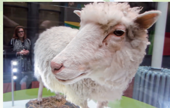
複製羊多莉已於2003年逝世，牠的標本展於博物館內。

育轉基因母牛。有些科學家野心更大，努力發展「生物製藥」， 16 製造出含有藥效成份的「藥奶」。1992年，英國愛丁堡大學宣佈他們已經生產了六隻轉基因綿羊，牠們的奶能專門醫治肝功能衰竭及肺氣腫等疾病。 17 1996年基因複製羊多莉聞名世界。1998年，美國麻省大學阿默斯特分校的研究團隊改進了基因複製技術， 18 結合轉基因技術，培植出含有人血清白蛋白的牛奶，其蛋白可以提煉成以藥丸或以注射形式出現，亦可如傳統的牛奶般直接飲用，其效用是維持血管的血容量。 19