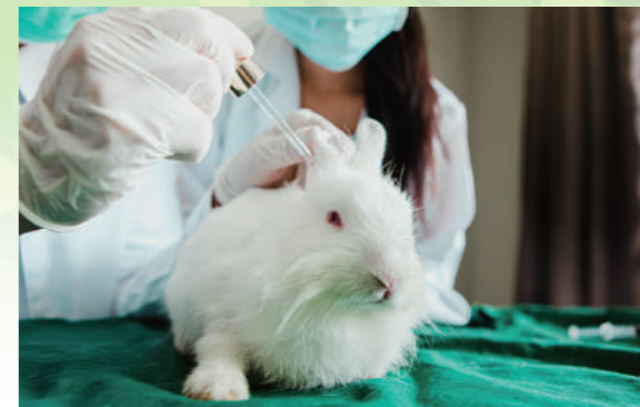
兔子往往在測試中受苦（設計圖片）。

是的，科學家無所不能，既然愈來愈多人關心受虐的小動物，不忍心牠們受苦，不如通過基改技術，製造一些無痛感動物出來，替人類接受一個又一個測試。