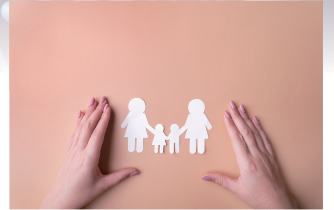
有學者研究女同性戀者的性傾向對下一代的影響。

五處的基因變異是與同性性行為有顯著的關聯，只是當再進行其他測試時，有兩處研究結果未能複製；而基因變異結果，也不能成為有力的依據。結論是：同性性行為不是由單一或少數，而是受到多基因變異影響。只是，這些可量度出來的變異，因著不同原因， 10 只能解釋少許的遺傳度（genetic heritability）， 11 而無法對個人的性傾向作出有意義的預測。很多不確定仍有待探究，包括社會文化如何影響性傾向，這都有可能與基因互相影響。 12