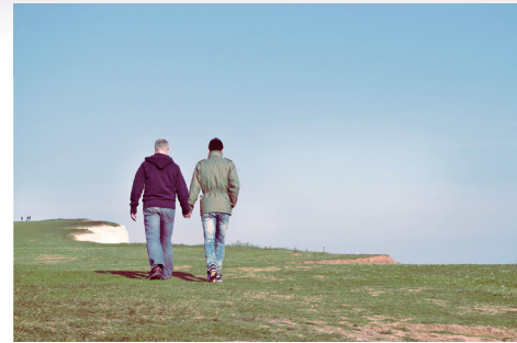
基因會影響人的性傾向嗎？

1993年Dean Hamer及其研究團隊表示已經在X染色體上找到一段DNA（脫氧核糖核酸），相信這與男性的同性戀有關。 1 該研究受到不少人質疑，主要是因為其他研究團隊進行了相同研究，卻未能得出Hamer等人的研究結果。 2 另外，Hamer研究的人數只有38對兄弟，樣本實在太少了。 3 無論如何，有關同性戀基因的爭論，日後便相繼而起。 4