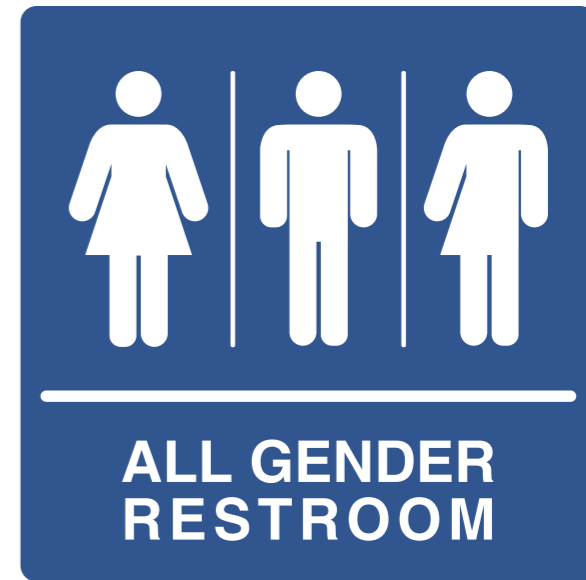
性別中立廁所的標示，在美國校園並不罕見。

場，以免日後觸犯法例。雖然此事發生在美國，她提醒我們跨性別運動其實已席捲全球，身處香港的我們也要有危機意識，為將來可能出現的立法爭議作好準備。 4