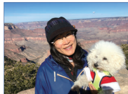
分享嘉賓阿Ming姊妹表示美國已有商舖設立性別中立廁所。

阿Ming估計法案一旦通過，保守團體將進一步遭受打壓，教堂不能拒絕讓性小眾人士在教堂舉行婚禮；領養服務機構必須配對孤兒給性小眾人士；教會機構被迫聘用違反機構理念的員工；小商戶不能按著他們的宗教及良心自由婉拒違背他們價值觀的生意……而事實上已有不少公司寧願選擇結業離