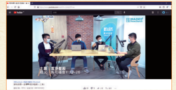
流堂製作的查經影片。