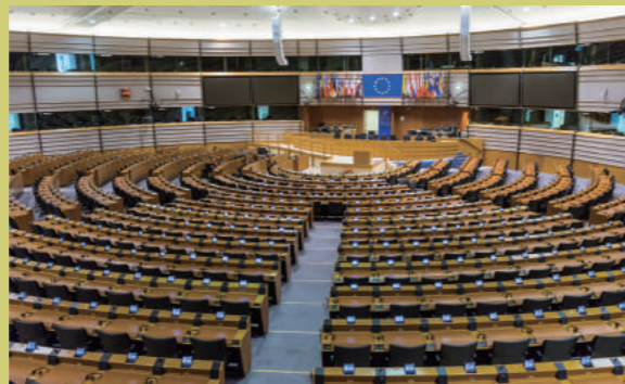
位於比利時布魯塞爾的歐洲議會議事廳。

2019年2月，13對同性伴侶於日本札幌、東京、大阪、名古屋和福岡入稟法院，要求政府就他們未能合法結婚造成的精神痛苦作賠償。2021年3月17日，日本札幌地方法院最先作出判決，駁回六位原告的索償要求，但裁定政府不承認同性婚姻是違憲。判決被指是日本LGBT+人士的象徵性勝利。