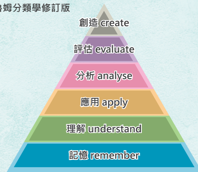
附圖：布魯姆分類學修訂版

在設計活動時，可以製造機會讓弟兄姊妹共同經歷，讓他們能「主動」分享自己想法，作出討論，再進一步評估及創造。Bloom的分類學將知識分為三個範疇，而在認知範疇 ( cognitive domain ) 階梯中，較低層次的思維是記憶 ( remember )、理解 ( understand )，這就像平日單向聽道的層次 ( 見附圖 )。 1