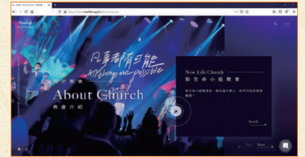
新生命小組教會的網頁，色彩繽紛悅目。

望見疫情未散，教會實在可以有很多探索的可能，特別在網絡世界，我們如能保持著人與人之間的結連，實在有助教導、牧養、關顧和培育信徒群體成長。即使未能面對面相聚，弟兄姊妹之間仍然可以有團契，享受一同敬拜和祈禱的生活，只要我們有多一點創意，聚會是不能、不應、亦不用停止的。❶