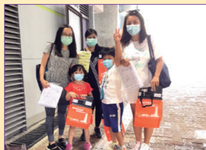
義工朋友精神奕奕的出發。