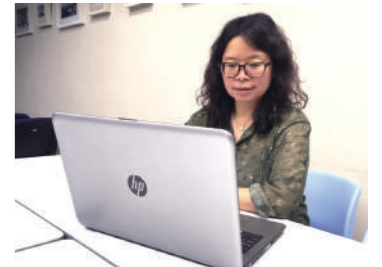
Helen透過《婚姻故事》 分享到夫婦的溝通。