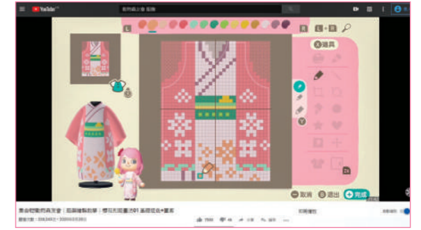
玩家可以在遊戲中設計服飾(《集合啦！動物森友會》遊戲截圖，圖片翻攝自Snownow game channel的YouTube影片)。

是故近日就有消息傳出，內地政府有意禁止任天堂內地版在內地銷售。這可能是一個兩敗俱傷的情況，因為任天堂對創意的堅持和不妥協，最後只能在黑市中求存。當然你同樣可以說任天堂求仁得仁，因為有麝自然香，即使黑市被打壓，還是會有市場的。我們會問，任天堂大可以在創作部份加上