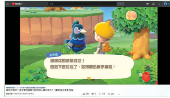
玩家可以與動物島民聊天(《集合啦！動物森友會》遊戲截圖)。

這種透過遊戲表達政治訴求的動作，在西方社會很常見，不少開放地區的遊戲，也會有玩家自行舉辦一些網絡聚會，既一起玩遊戲，亦同時聊天聚會。本來這種遊戲就有讓網民互動的機制，不過當有政治進入遊戲，就會引來政權擔憂，要求減少相關的溝通和收窄創作的空間，好使有關的遊戲活動在網絡中受監管和操控。