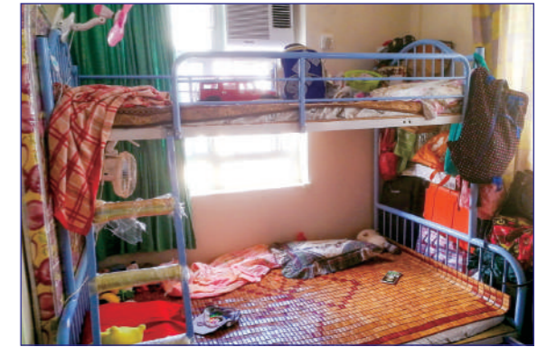
故事一那位媽媽帶著大兒子，居住在150呎的套房中。

受訪的媽媽跟兒子，住在一間套房裡，面積約150呎左右，裡面有一張碌架床，迷你的洗手間及開放式的廚房。房間的打掃比較整潔。從開門招呼我們，到整個訪問過程，戶主媽媽一直都努力保持著微笑。她由內地來港，有一對雙生的兒子，訪問時，只有大兒子和她在一起。她說，兩個兒子早產，直到三、四歲才發現他們異於常人。大兒子今年11歲，卻只有三歲的智商，而且還患有專注力不足 / 過度活躍症，返半日制特殊學校，需要每天由媽媽接送。小兒子則因諸多病痛，需按時吃很多藥，住在特殊寄宿學校。由於不適應那裡的飲食，這位媽媽便不時煮飯並送過去給兒子。當被問及