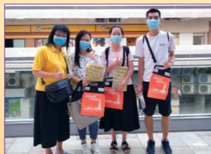
感謝義工朋友的同行。