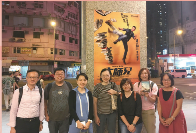
導師肇峰(右二)、本文作者(右三)與各同學到豪華戲院看電影。

期間，大家除了在課堂上一起欣賞各地的電影，當中包括：《出貓特攻隊》(泰國校園劇情片)、《一路順風》(台灣公路電影)及《王家欣》(港式都市浪漫愛情喜劇)，更特意前往《王家欣》的拍攝場景——位於旺角的豪華戲院，並