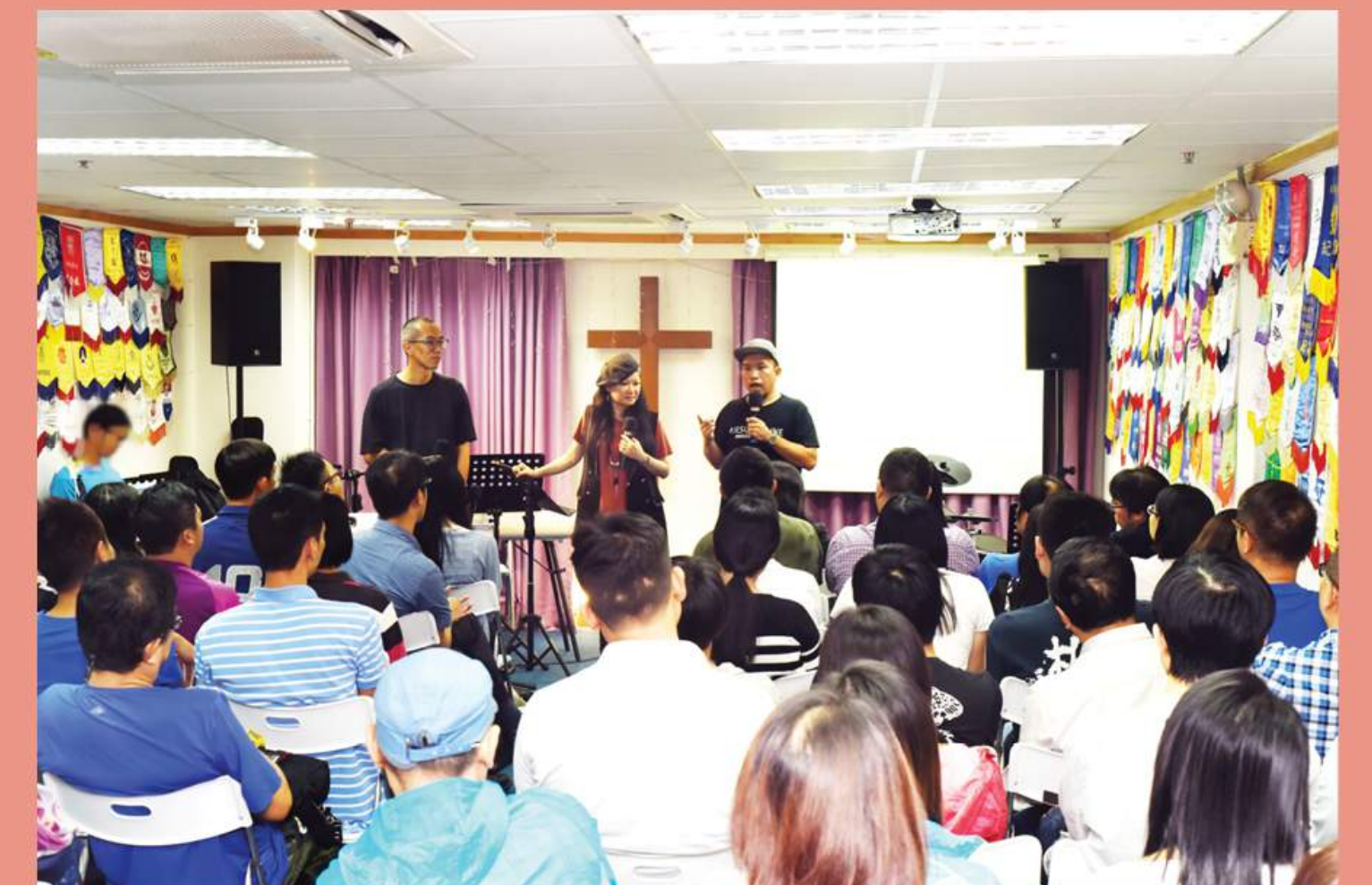
不少人出席參與研討會。

幾次研討會過後，不難發現這講座系列的參加者鮮有重覆，我們就更肯定「教牧後援會」的需要，也更肯定他們是對議題略有了解才會來。以「教會有個腐女團契」研討會為例，就真的有位導師邀請了團契中的青少年肢體來聽和分享，既幫助導師解惑，明白「腐的真諦」外，同時也讓與會的青少年感受到導師的關心。在「考試季節·教會的考驗」研討會中，就有考生家長和團契導師一起商討支援DSE考生的方法，以及教會的角色。