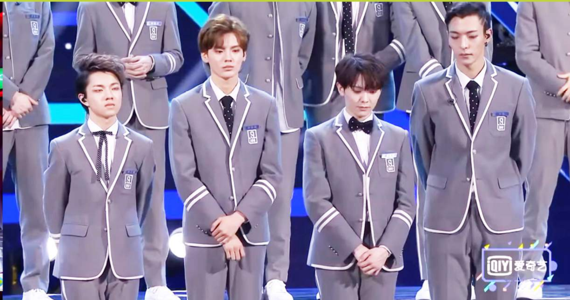
賽果影響著參賽者的星途，圖片來自《偶像練習生》。