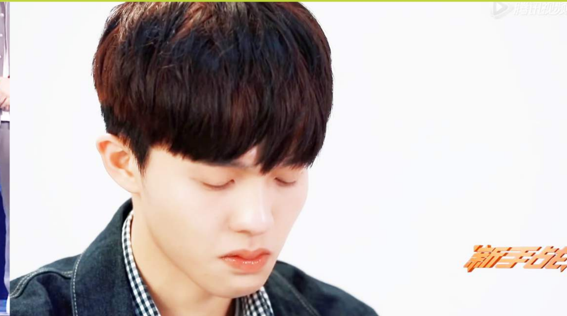
參賽者在節目中備受壓力。