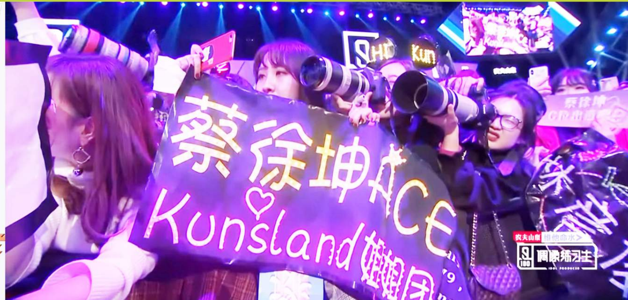
粉絲傾盡全力為偶像打氣，圖片來自《偶像練習生》。

近年香港的娛樂圈被形容為星光黯淡，各大公司未有培育新一代的歌手和藝人。不過不少香港人卻去了內地、韓國等地方做練習生，參加選秀節目，甚至於當地出道成為藝人。韓國、日本、甚至內地均透過網絡來進行偶像行銷，吸引世界各地的粉絲來支持。這「圈粉」（成為偶像的粉絲）的過程是怎樣產生的呢？這對青少年偶像崇拜的潮流，帶來甚麼改變？