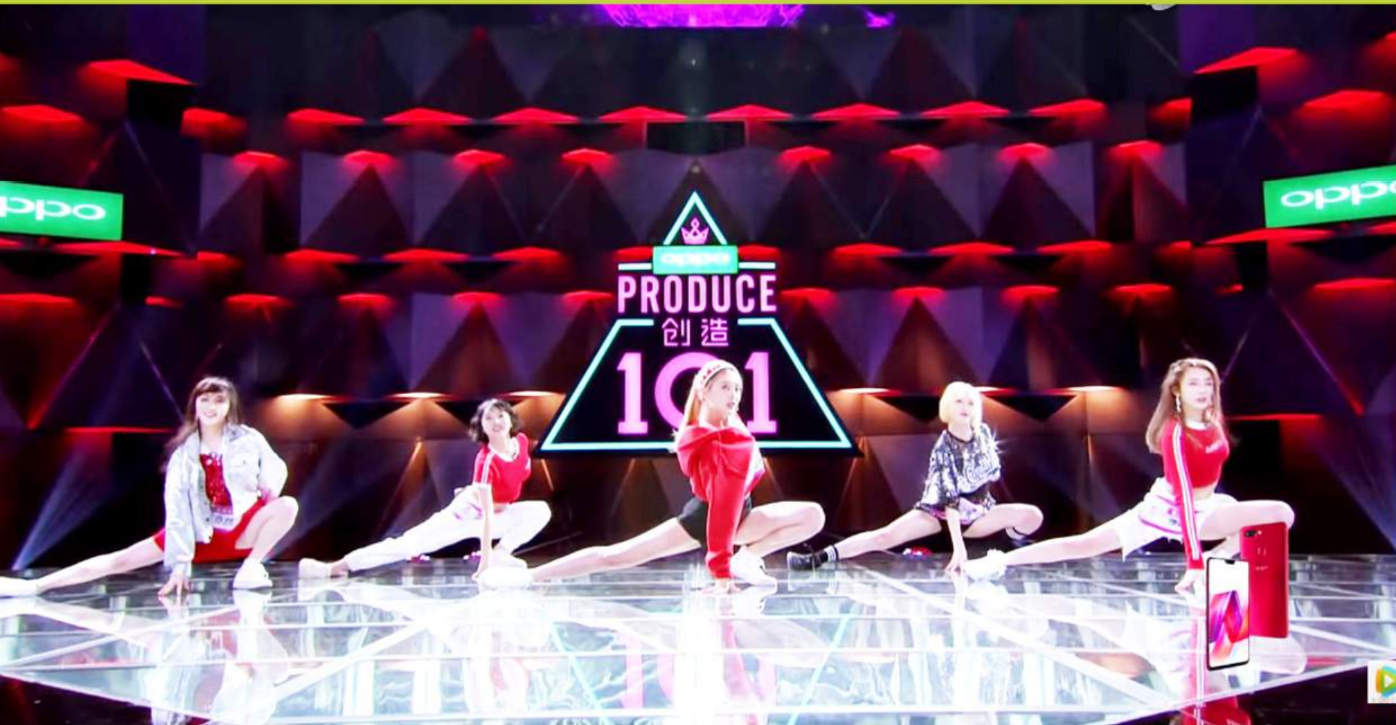
參賽者在節目中較量歌藝和舞藝，圖片來自《創造101》。