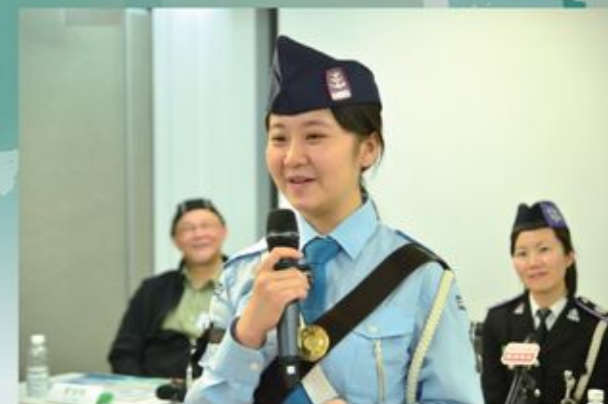
同學在記者會上分享褪網心路歷程。