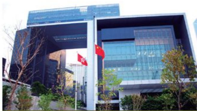
政府突然在本年2月宣布重新啟動《淫褻及不雅物品管制條例》的檢討工作。

創作自由應該得到尊重，但不能為求銷量而「走法律罅」。家長亦要小心提防，為子女作出合適的指引。