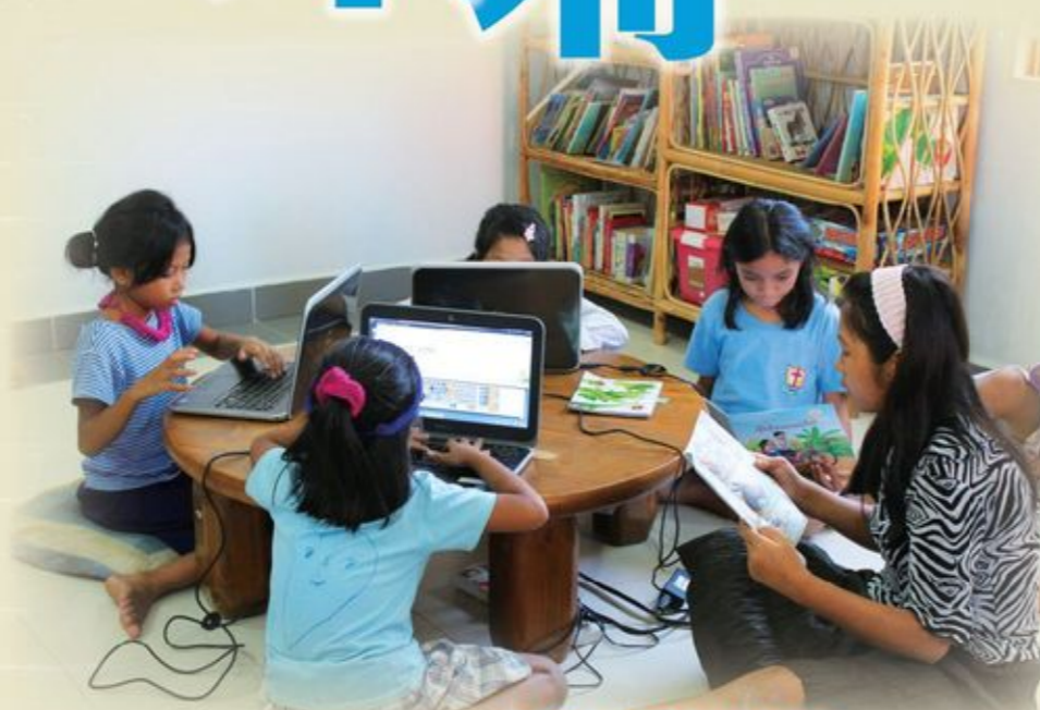
為了讓女孩有獨立生活的能力，豐榮團契會為她們提供教育。

豐榮團契的目標及定位十分清晰，透過籌辦豐榮女兒之家，希望喚醒教會及社會對性侵犯與性剝削的認識及關懷，並社會人士親自伸出援手去擁抱這群受性摧殘或高危成為性販賣的稚齡女孩。該機構又在2014年興建豐榮女子學校，除了希望透過教育令貧困家庭的女孩得到學習的機會，更希望達到抗衡及預防人口販賣的長遠果效。