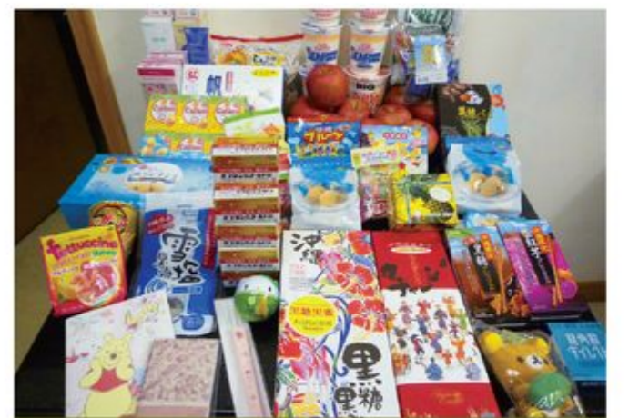
其實買水貨或走水貨也不一定只是內地客專利，不少經常訪日的朋友，離港前也會問問親朋需不需要購買各式的日本貨。

如果要說水貨客有問題，這個問題的癥結只能說是內地客數量太多，而香港卻是面積太少，賺不起他們的錢。而內地客數量太多這個問題並不只是香港獨有，也是全球不同地方遇上問題，可見我們不是唯一的「受害者」。所以，所謂水貨問題，其實就不是「走水貨」本身的問題，而是人的問題。