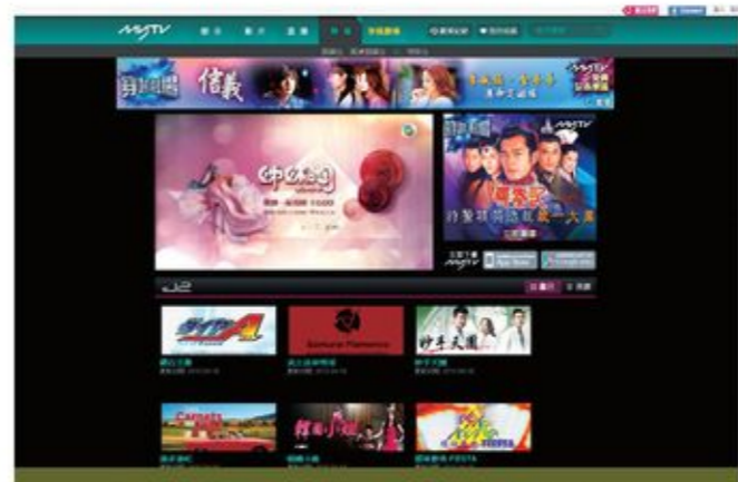
無綫J2頻道一向以青少年為目標觀眾群，若現在加入賭博節目，即變相將賭博帶到青少年社群中。

現時馬會大部份節目是由自己製作，它實在可考慮自行承辦「十八禁」的賽馬節目和頻道，一方面讓馬迷及投注人士仍然可以接收相關資訊之餘，另一方面亦可以盡量減少對青少年的影響，請馬會「放過孩子」！