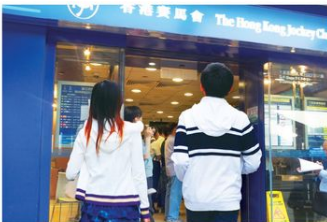
大部份 18 歲青少年仍然在學，心智尚未完全成熟，若要他們過早承擔太多從賭博而來的責任和後果，未免太沉重。

就是外地，不同地方的成人禮也有不同年齡，有些在 20 歲，甚至 25 歲。現代社會愈來愈複雜，不同的價值觀如消費文化在衝擊我們。就賭博議題，我們認為大部份 18 歲青少年仍然在學，心智尚未完全成熟，若要他們過早承擔太多從賭博而來的責任和後果，未免太沉重。因此，賭博年齡理應延後至少三年至 21 歲。成熟其實是一個循序漸進的階段，而不是靠一個神奇的數字。