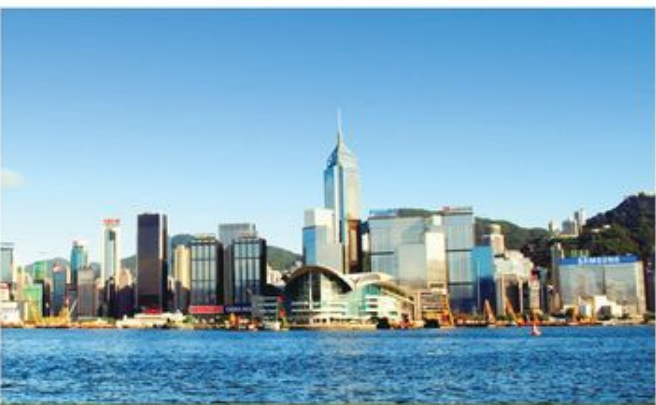
近年，香港不斷在討論「新移民」、「自由行」、「內地客」等問題。在論述此等問題時，我們往往將「香港人」突顯，二話不說就認為「我們香港人，就不會像他們這樣那樣。」

「香港人」是一個身份，基督徒亦然。但願不論我們以甚麼身份在社會上活著，在確立身份的過程中，我們靠的不是踐踏其他人，也不是靠傳媒的造勢，而是每個人在生活上的踐行。