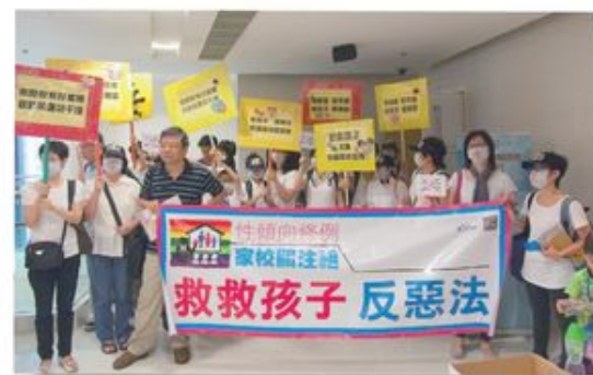
來自關注組的一班家長和老師甘願冒著被抹黑打壓的風險，挺身而出在公共空間表達反對意見。

今年9月23日，當颱風「天兔」漸漸遠離本港之際，平機會亦宣布於當日下午舉行的「平等機會委員會論壇2013」按原定計劃舉行。是次論壇旨在讓公眾參與討論平機會的「三年策略計劃」，除了有不同團體到場為弱勢社群發聲，亦有一群來自「性傾向條例家校關注組」(關注組)的家長帶同子女到場外請願。今期城市熱話，我們訪問了關注組的發言人，從家長和教育角度了解他們對立法的關注。