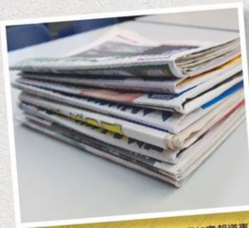
報紙作為報道媒介，當然必須如實報道事件，但最後容易變成「人肉錄音機」，對事情沒有全盤消化並帶出重點。

不過，老紀透過互聯網嘗試整理及還原消息有一定風險。一般傳媒務求公道，通常對政府提出質疑的同時，會發傳真向有關政策局提問並要求回覆，甚至要等到書面回覆後才刊登報道。但老紀知道，對方可以拖延，也可以回覆，迫你用他的官方說法，於是他決定不會每次都等待政府回應。對事實已擺在眼前的資料，老紀會直接利用翌日出街的報道來提出質疑質詢。他說：「喂，CY（梁振英）講嘢已經有電視台24小時咁同佢 loop（不斷播放），我點解仲要等佢覆，依家的新聞根本就已經唔係平衡報道啦。我們砌返個事實，做比較，亦有時間做，已經對佢好公道，有啲嘢 logical sound（邏輯上合理），如果有風險，都要冒。」