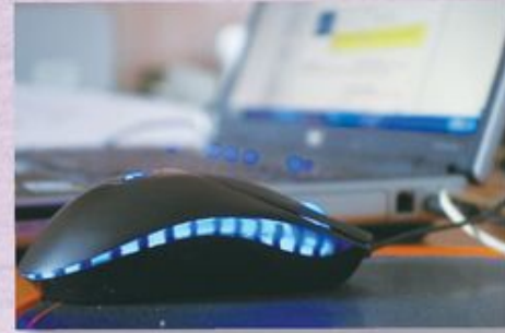
不少突發記者近年轉行，部份改為監察網絡，見到社交網絡有甚麼可以「炒作」的消息，專門將之推上報。

報或不報，但將這些未經證實的消息作為各種政治力量「進可攻、退可守」的策略，變相將傳媒公信力量置之不理。其實，就算消息真確亦非全無問題，因為有關官員或政客若看到民意有很大反彈，亦可立即變臉，矢口否認；若消息是假，傳媒往往亦不了了之，含糊其辭。結果讀者只能看到一個混亂的社會，當記者、編輯放棄疏理時局的社會責任，只任憑消息亂飛，與官員政客同樣是不負責任。