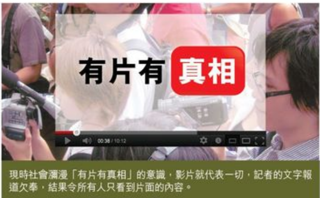
現時社會瀰漫「有片有真相」的意識，影片就代表一切，記者的文字報道欠奉，結果令所有人只看到片面的內容。

這幾個月，特首應否辭職、局長應否下台、老師應否被炒都似乎真的有人頭落地才能令一些人滿意。但政府高官的申報制度、警權問題、知識產權如何獲得社會尊重等問題，就因為網絡這種「百字」文化，不被重視。長此下去，恐怕完全無助改善制度，只會有多人因失望而離場。