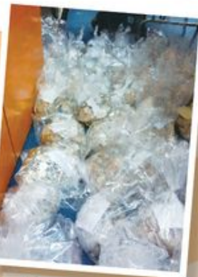
我們發現原來十幾萬元的硬幣是那麼重，拿著那一袋袋沉甸甸的錢幣，心裡實在感動。