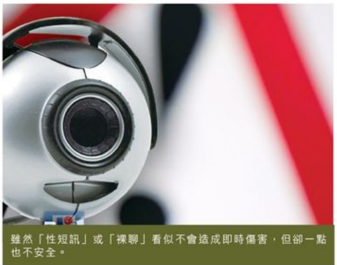
雖然「性短訊」或「裸聊」看似不會造成即時傷害，但卻一點也不安全。

送出了的資訊，永遠收不回，別人如何使用，你控制不到。雖然「性短訊」或「裸聊」看似不會造成即時傷害，但卻一點也不安全。不要因這種非直接的溝通而將身體界線模糊化。若在現實世界大家不會（亦不願意）隨便向他人裸露，在虛擬世界更不應該，因為在虛擬世界其實有更多的「觀眾」。