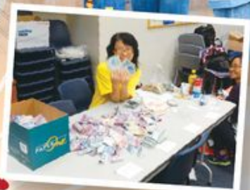
在剪旗袋及點算款項的過程中，每當同工發現有100元甚至500元的紙幣時，大家都會十分興奮。