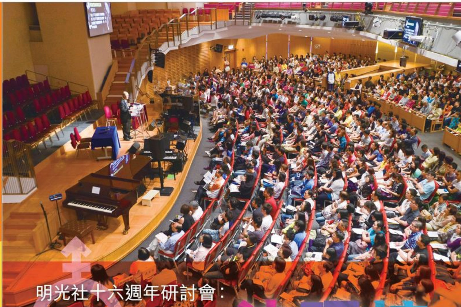
明光社十六週年研討會：