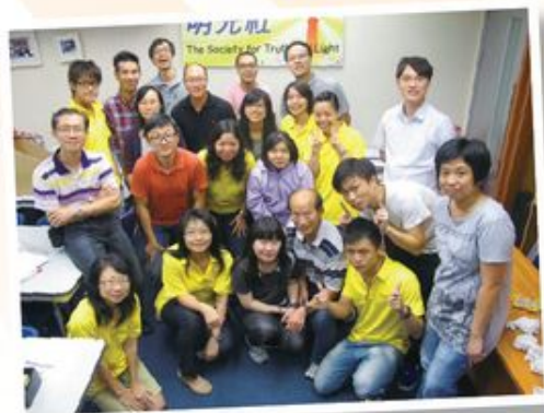
本社再次多謝每一位曾為賣旗日出力的義工、團體；本社的支持者、捐款者及代禱者；借場地作旗站及傳旗袋收集捐款的學校、團體及教會。

在此再次多謝每一位曾為賣旗日出力的義工、團體；本社的支持者、捐款者及代禱者；借場地作旗站及傳旗袋收集捐款的學校、團體及教會。您的支持，對我們的工作非常重要，亦是對明光社全體同工極大的鼓勵。我們將善用這些得來不易的捐款，在未來的日子繼續緊守崗位、毋懼困難及風雨，作鹽作光。