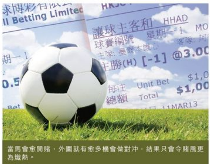
當馬會愈開賭，外圍就有愈多機會做對沖，結果只會令賭風更為熾熱。

鍾博士最後建議政府必須加強支援現時的戒賭輔導服務；而且亦要求馬會在彩池的數量上，不論在可供賭博的地區和場數都必須克制，並要開始處理青少年網上賭博的問題，再不能以視而不見的態度對待。