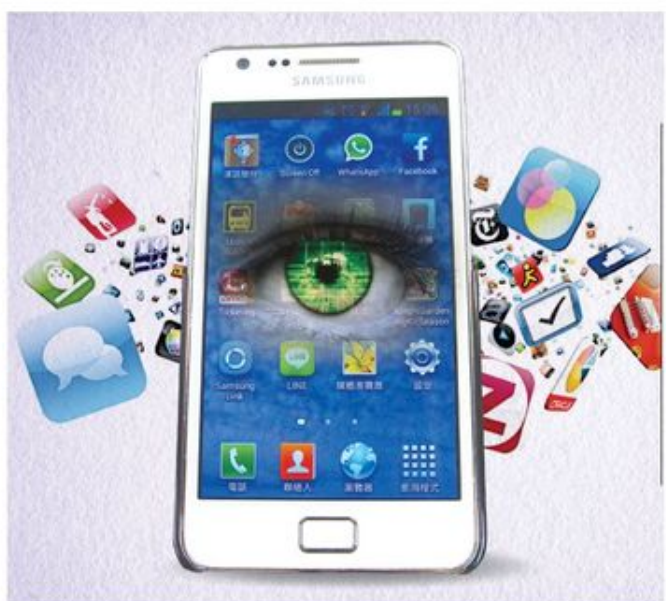
不少程式無充份理由讀取用戶的個人資料，甚至其他程式的帳戶資料，其實與被「起底」無異。

其實市面上有不少功能上相似的程式，若手機是Android系統，用戶可於安裝前於「權限」頁看到程式可讀取的資料類別，便可以從中作出選擇，然後才決定是否安裝。而使用iOS平台的用家，也可於下載該程式後，於「設定」內選擇「隱私」，在當中除可知道哪些資料會被檢視外，更可選擇該程式的某些權限。此外，用戶亦應不時檢視已下載的程式，若發現有些沒有用的程式時，便應該刪除。