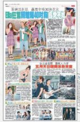
〈Mika 沙灘犯禁「隨處偷腥」〉，《星島日報》，2013年7月9日，第D3版。