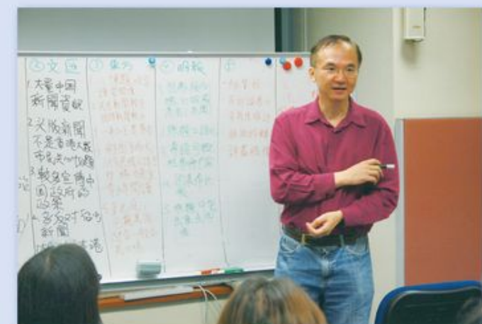
說到現時不少報道充滿立場，張博士建議學生對不同報章的內容進行比較。

現時學校講求青少年要懂得批判思考，張博士卻覺得「只做了前半（批判）」。他說現時學生們的挑戰很多，其中一項是面對大量的資訊。現今學生要思考的是：究竟應否