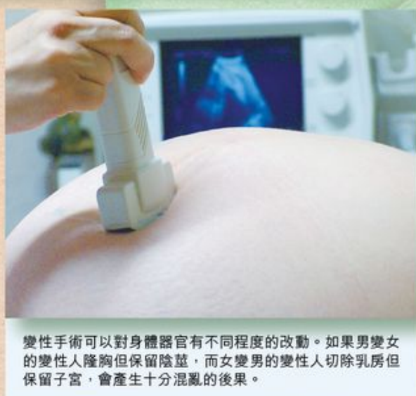
變性手術可以對身體器官有不同程度的改動。如果男變女的變性人隆胸但保留陰莖，而女變男的變性人切除乳房但保留子宮，會產生十分混亂的後果。

不過，變性手術可以對身體器官有不同程度的改動。如果男變女的變性人隆胸但保留陰莖，而女變男的變性人切除乳房但保留子宮，會產生十分混亂的後果。外國曾有保留子宮的男變性人 (FTM) 懷孕產子， 4 亦有保留陰莖的女變性人 (MTF) 進入女更衣室對使用者造成困擾。 5