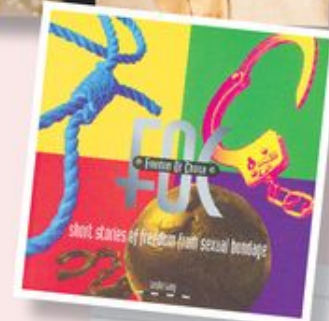
龍仕功撰寫的書 Freedom of choice