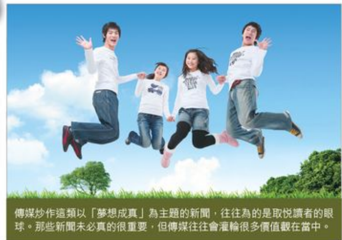
傳媒炒作這類以「夢想成真」為主題的新聞，往往為的是取悅讀者的眼球。那些新聞未必真的很重要，但傳媒往往會灌輸很多價值觀在當中。

不過，我們不要被這些新聞的華麗外表所影響。我們要問的仍是一些簡單的問題：作為基督徒，我們在作甚麼？而甚麼是成功？為我們下定義的應該不是報章，也不是我們身邊的人。基督徒選擇的，是將生命交給主的路。如此，我們的「成功」就不一定為世人所認同。這也是基督徒群體最重要的特質，不能隨意任由社會定義。