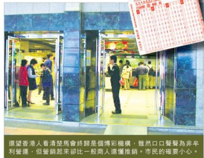
還望香港人看清楚馬會終歸是個博彩機構，雖然口口聲聲為非牟利營運，但營銷起來卻比一般商人還懂推銷。市民的確要小心。