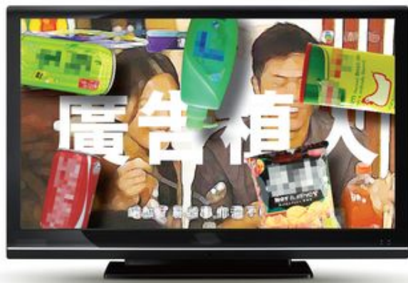
有人一看到廣告便「飛頁」，並不受到影響。但正所謂「你有張良計，我有過牆梯」，現在有不少廣告模仿成報道，甚至混入節目中，令大家無處可逃。

當傳媒容讓廣告以任何形式入侵時，讀者亦要留心每篇報道是否有廣告成份，最後受到影響的其實是傳媒的公信力，實在令人惋惜。