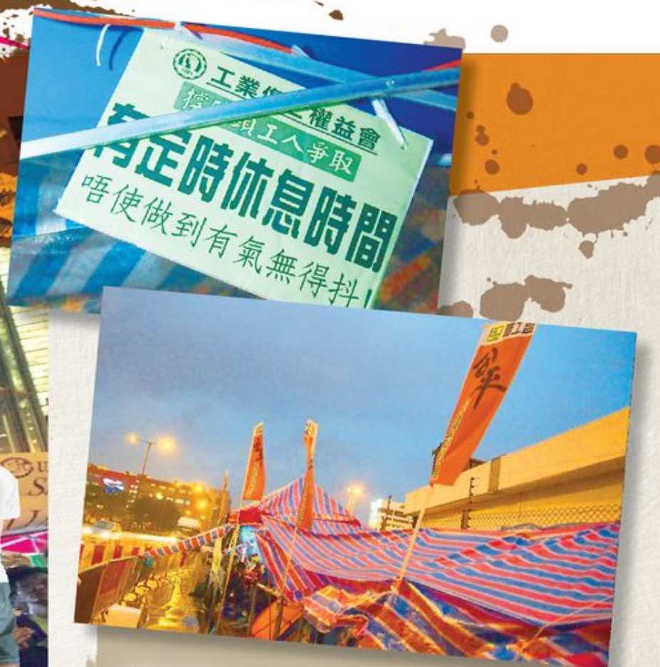
就是次工潮而言，國際貨櫃碼頭 (HIT) 便一直以和黃並非外判工人的僱主為由，拒絕參與談判。

根據英國傳媒報道，蘋果電腦的外判商富士康的中國工人每小時的薪金只有 1.12 鎊 (約港幣 13 元)。 1 工人如果想擁有一部 iPhone，他們便至少要工作兩個月。而且，工人生產這些產品的環境容易受到有毒金屬的污染，令身體出現無法彌補的永久性傷害。曾有工人就因為在這些「血汗工廠」(sweatshop) 承受不了惡劣的工作環境和不合理的工資而選擇結束自己的生命。蘋果電腦雖然和 HIT 一樣並非這些工人的直接僱主，然而她也有不能開脫的道德責任。在近年國際傳媒的不斷抨擊下，為了顧及企業形象亦不得不象徵式地做一點公關工作，例如派員到中國勘察生產環境，富士康也不得不作出多次加薪以平息自殺潮。