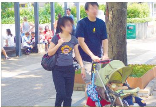
若家庭功能良好地發揮，孩童可得到最好的栽培，亦能促進社會的穩定，對社會產生莫大的好處。

若家庭功能良好地發揮，孩童可得到最好的栽培，亦能促進社會的穩定，對社會產生莫大的好處。2012年，明光社聯同二十九個團體登報聯署聲明，期望新一屆政府能落實更多家庭友善的政策，保護一男一女的婚姻家庭制度，投放更多資源以強化家庭凝聚力。新政府上場差不多一年，暫時未有推出甚麼明顯對家庭友善的政策，期望剛成立的「標準工時委員會」能有所作為，讓一眾家長能得到應有的工餘時間，用以好好教養孩童。