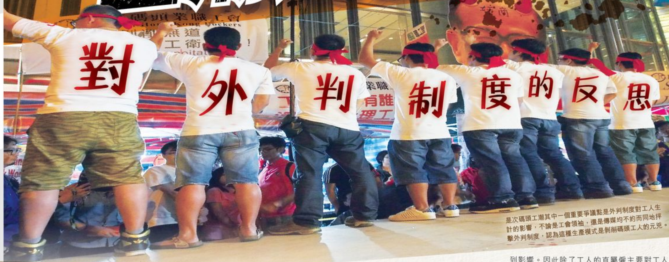
是次碼頭工潮其中一個重要爭議點是外判制度對工人生計的影響，不論是工會領袖，還是傳媒均不約而同地抨擊外判制度，認為這種生產模式是剝削碼頭工人的元兇。

本年五月六日，葵涌貨櫃碼頭外判商和碼頭工人代表以 9.8% 的加薪幅度取得共識，長達四十日的碼頭工潮終於結束。是次工潮讓市民有機會透過傳媒認識貨櫃碼頭的運作，有些熱心的市民甚至親身接觸工人，提供物資和精神上的支援，當中更有人加入工潮與工人一起對抗資本家。不過工潮過後，有不少問題其實仍值得香港社會深思，今期城市熱話讓我們探討外判制度的爭議。