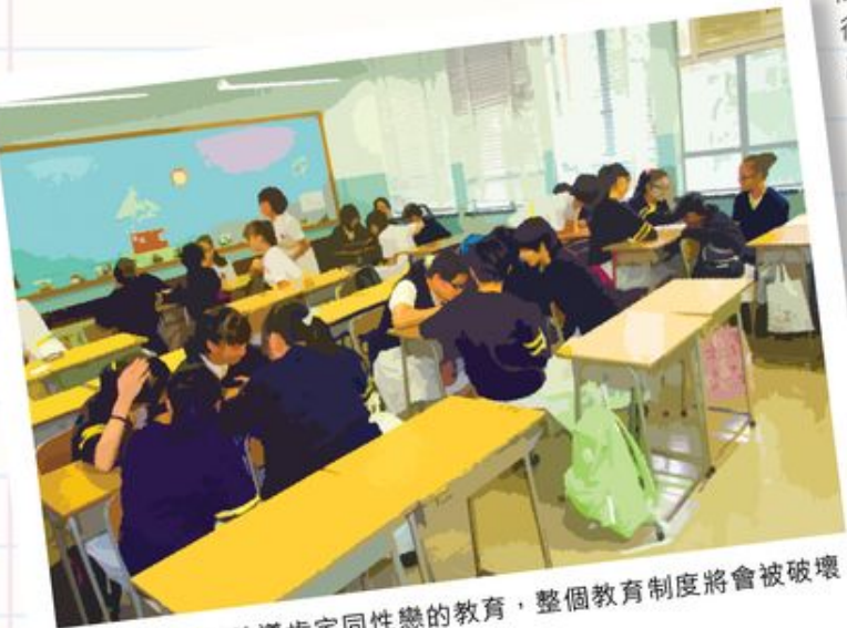
若立法後只可教導肯定同性戀的教育，整個教育制度將會被破壞，多元的聲音亦不再被尊重。

www.davidparkerfund.org/MotionToDismiss.pdf