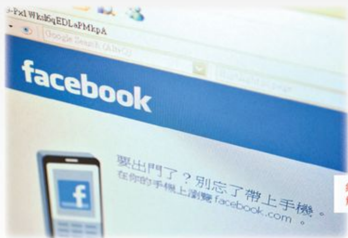
網上言論也可能觸犯歧視法

其他案例太多，未能盡錄，請參考本社網頁： http://www.truth-light.org.hk/statement/title/n3925