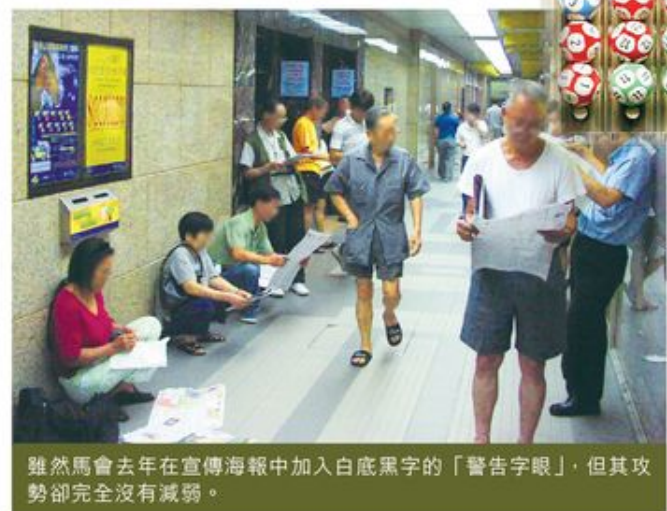
雖然馬會去年在宣傳海報中加入白底黑字的「警告字眼」，但其攻勢卻完全沒有減弱。

展望2013年，提升合法賭博年齡勢必成為反賭風的大方向，賭波合法化的十年，我們看到足球運動在電視上整體的變質，由欣賞變成賭博，同時看到外圍賭業蔚然成風。香港能否守住現時不鼓勵賭博的政策，看來只能靠民間各團體持守和結集力量，否則賭權隨時開放，最後損失的，將會是社會整體利益。