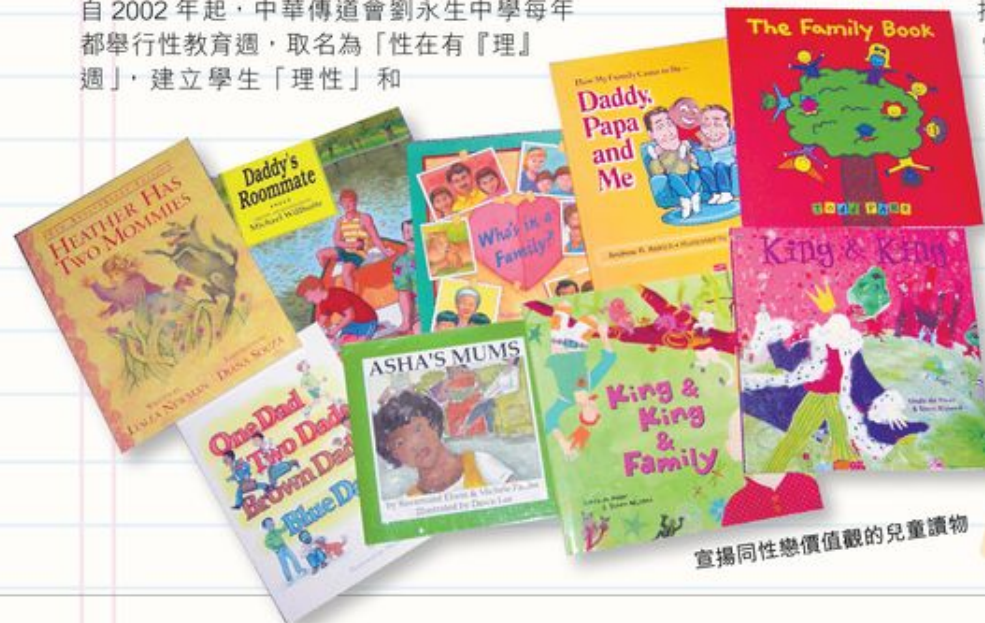
宣揚同性戀價值觀的兒童讀物

另外，學校亦會就不同範疇的個案制訂相關的程序指引，指導老師怎樣介入和處理，包括懷疑同性戀的個案。校方表示在輔導過程中，並非要他們接受或改變甚麼，而是強調理性選擇。事實上，青少年對自己的性傾向感到疑惑是正常的，不需要急於斷言自己是否同性戀者。學生要明白同性吸引、同性戀行為及同性戀者身份的分別，一個人即使有同性吸引，也非必然有同性戀行為，或以同性戀者作為其身份。他們是可以有選擇的，而且同性性傾向是有可能改變的。