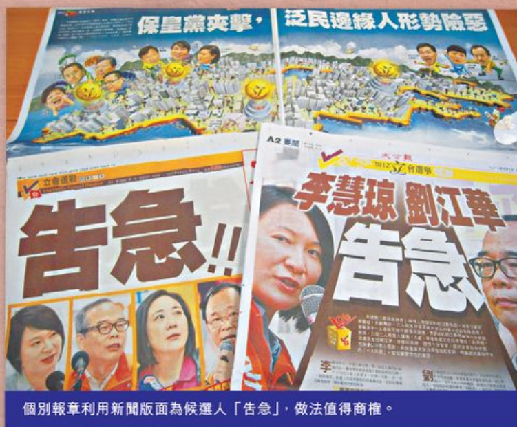
個別報章利用新聞版面為候選人「告急」，做法值得商榷。