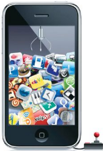
不少供智能手機免費下載的應用程式，都含有不良資訊。

事實上，相信一般市民未必知道，這些應用程式是屬於《條例》的管轄範圍，況且至今亦未見任何關於上述程式的評定類別通告。我們希望政府有關當局能加強執法，並向公眾交代有關色情程式的評級流程。同時亦要加強宣傳，讓大眾知道，若發現手機程式含有不良資訊，可以向當局作出投訴，避免這些程式荼毒我們的下一代。