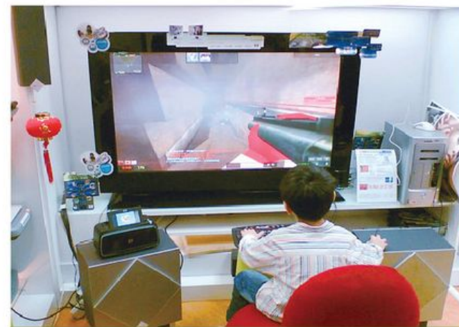
網絡遊戲隱藏不少陷阱，玩家要格外留神。

如此遊戲，更易投入，更易找到志趣相投的朋友，但同時遊戲沒有教你分辨善惡，還告訴你一切只是「選擇」時，我們發現遊戲不再單純，也要更留心背後的價值觀和意識形態了。