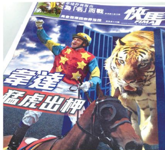
免費馬報的出現，或令更多市民容易接觸到賭博的資訊。

隨著近年本港消費指數飆升，早前已有報章形容，今年 9 月的一億元獎金六合彩，實質購買力，也不及 2003 年頭獎最高金額的那七千多萬元，證明六合彩根本不再神奇，更多時只是虛幻的數字遊戲。既然如此，我們質疑政府為何仍不管理香港的博彩資訊，減少青少年，甚至香港整體市民誤陷賭博的深淵之中？