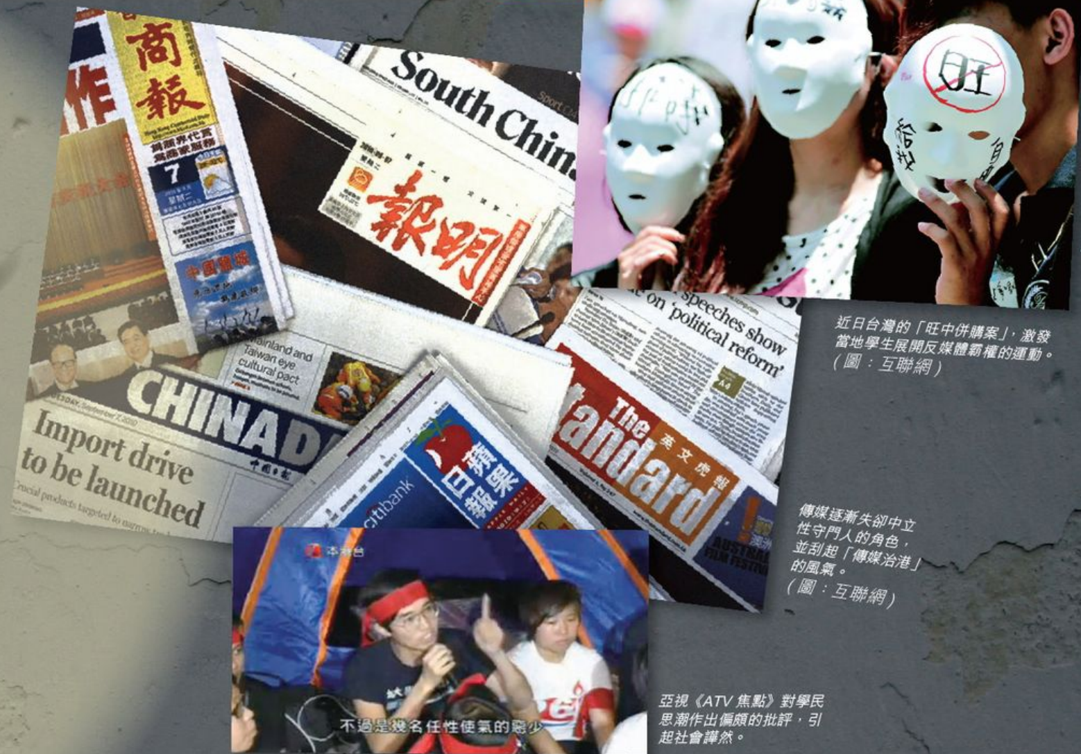
近日台灣的「旺中併購案」，激發當地學生展開反媒體霸權的運動。

即使在亞洲區，情況亦不遑多讓，當香港為反國民教育鬧得熱哄哄之際，台灣的校園卻為反媒體霸權而高呼。事緣台灣早前通過「旺中寬頻購併中嘉有線電視系統案」，導致七百多名學生前往「旺中」總部，抗議此集團扼殺言論自由，學生的抗議行動，主要是痛批此集團為求私自利益，凡對該集團有質疑、批評的言論，都將會遭到「旺