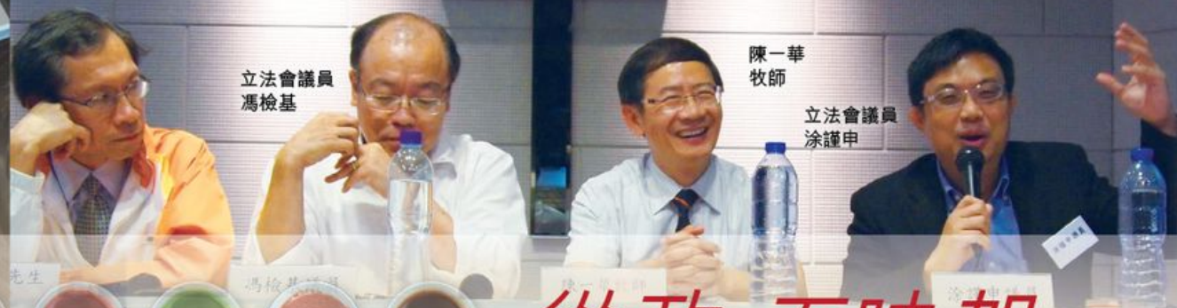
立法會議員 馮檢基

兩年前馮檢基的同事迫他開 facebook，他們說：「你唔玩都要上去睇下年輕人嘅心聲！」面對批評，阿基試過因回覆了一些網民不中聽的說話，結果換來群情洶湧的網絡圍剿，於是他在 facebook 訂下「三不」家規：「第一，我會 Delete 講粗口的留言；第二，大聲夾惡者會被記大過；第三，中傷別人者亦記大過。儲夠三個大過，他的留言就會全部被 Delete。這樣，facebook wall 就乾淨了。」陳牧師見奏效，立即說：「教我點樣 Delete 呀！」惹來全場大笑。