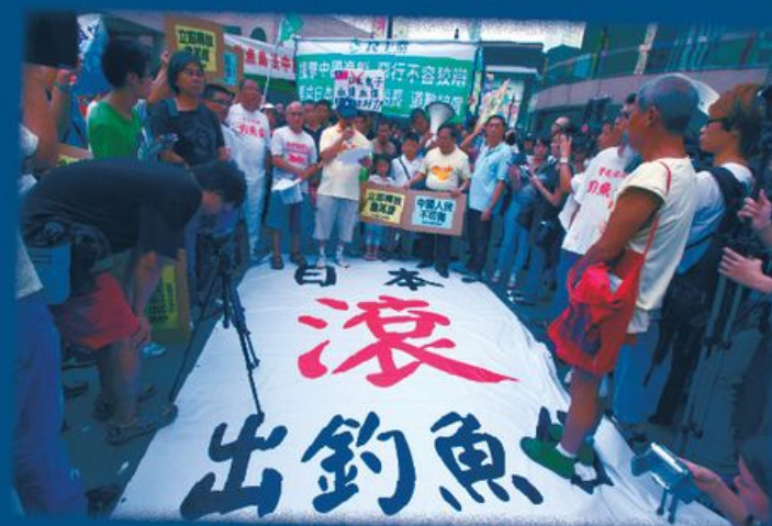
保釣運動成為全球華人一個備受關注的課題，記者的情緒也容易受牽連。

記者首先要保的不是釣魚台，而是本身的客觀中立和公信力，任何個人的政治理念、私人關係、民族感情、甚至宗教信仰，都不應該影響報道的公正性，否則我們的傳媒只會充斥偏見，遠離事實。