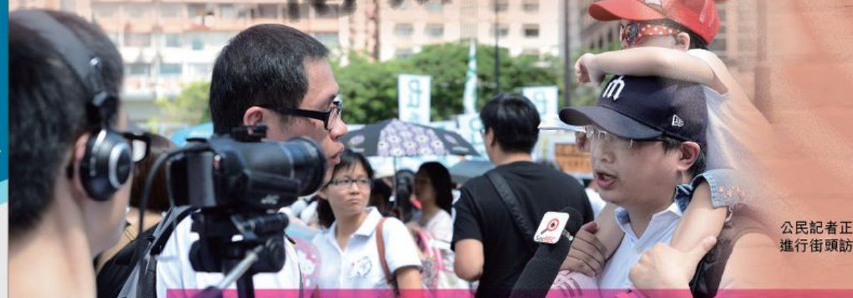
公民記者正在進行街頭訪問。

要談香港的傳媒生態，除了傳統的新聞媒體外，不得不提「公民記者」。公民意識抬頭，加上智能手機普及化，香港人已很習慣把碰見的新聞故事即時拍攝或錄影下來，然後透過網絡平台發佈開去。與此同時，近年本港也愈來愈多由民間人士組成的「公民媒體」，它們在新聞發酵及加溫方面，都扮演著重要的角色。究竟隨著「公民記者」或「公民媒體」的發展愈趨成熟，香港的傳媒生態會有甚麼轉變呢？