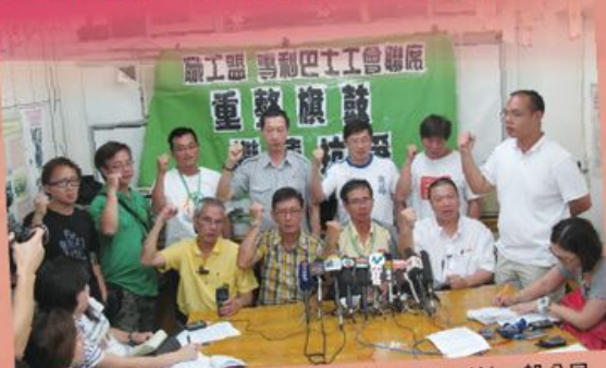
傳統新聞媒體的記者皆受過專業訓練，有別於一般公民記者。(資料圖片)

除了獨立的「公民記者」，近年香港亦有不少由民間人士組織而成的「公民媒體」，例如「主場新聞」、「獨立媒體」、「輔仁媒體」、「SocREC 社會記錄協會」等，它們都號稱不