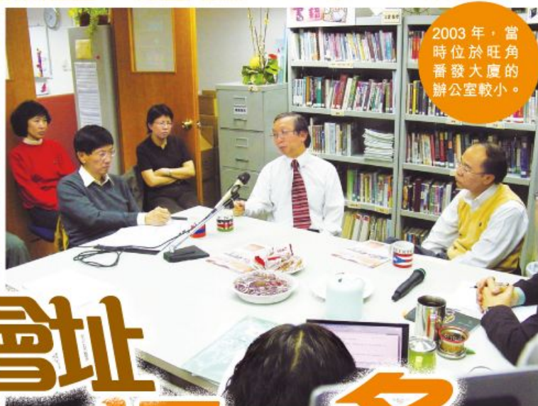
2003 年，當時位於旺角番發大廈的辦公室較小。