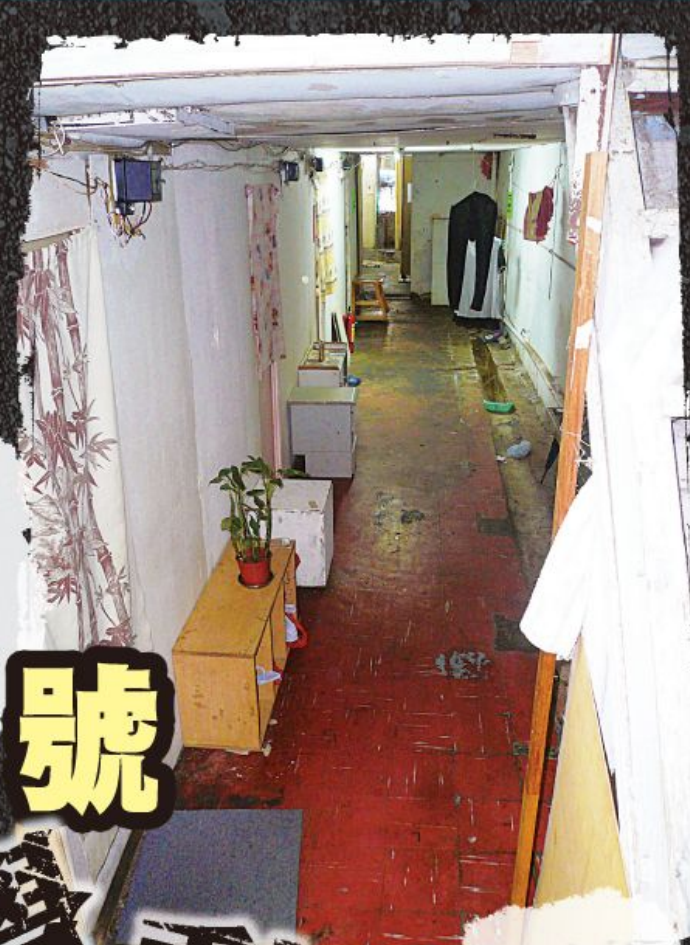
大角咀洋松街有工業大廈早前被改建成多間劃房。

原來五樓被劃成上、下兩層，其中五樓上層的一邊只有半個身（約一米）的高度，據說這類房租大概要一千元。另一邊則是用鐵架僭建而成的。上層很黑暗，為了「善用」每個空間，住客每日要屈身進出，彷彿每次都要卑躬屈膝，放下尊嚴地進出自己的「家」中。這樣的居住環境是香港之恥，令人心憤慨激盪。每間房的外面連帶一個抽氣扇，沒有甚麼大作用。其中一間房的間隔最惡劣，其結構與木梯相連，因此要跨過近一米高的木板才能進出房間，房內的高度當然只能坐，不能企，令人心酸。