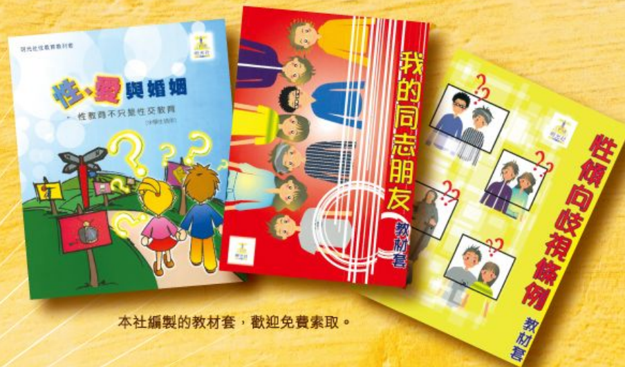
本社編製的教材套，歡迎免費索取。

另一方面，對於社會上不斷有人要求娼妓合法化，我們一直反對，亦不贊成娼妓是人權。我們經常出席各大專院校舉辦的性文化節參與學術討論、接受電台及電視台訪問、於報章撰文，以及出席立法會的公聽會，向議員及社會大眾闡述我們的理據。但在反對之餘，我們亦呼籲教會及機構正視這些被社會剝削的婦女的處境，為她們提供就業培訓，希望她們可以脫離當娼生涯。