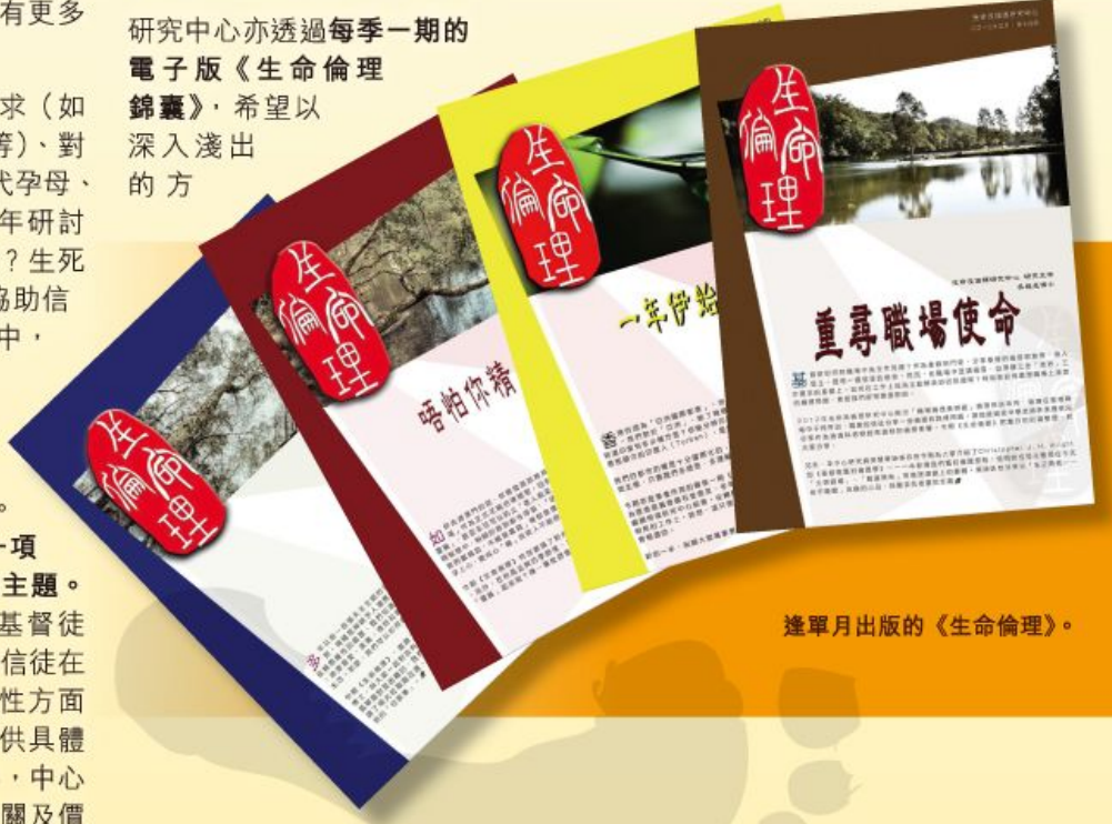
逢單月出版的《生命倫理》。

展望：從現代社會走到後現代社會 過去 50 年，我們從現代社會走到後現代社會，生命及倫理價值的改變，給信徒和教會帶來很大的衝擊。這種衝擊，甚至在不經不覺間改變了信徒的想法。當後現代人強調以自我為中心的自由和權利，只著重滿足一己的慾望和益處，他們往往不尊重生命和漠視賜生命的上帝，那便會引發一系列的倫理及社會問題，例如：濫交、婚外情、離婚、同性戀、代孕母、墮胎、自殺、濫藥和嗜賭等。雖然這些問題存在已久，惟分別在於從前認為是違反道德規範的，現在卻是常規化了、合理化了，甚至辯稱道德規範隨時代轉變了；加上後現代主義打起批判判