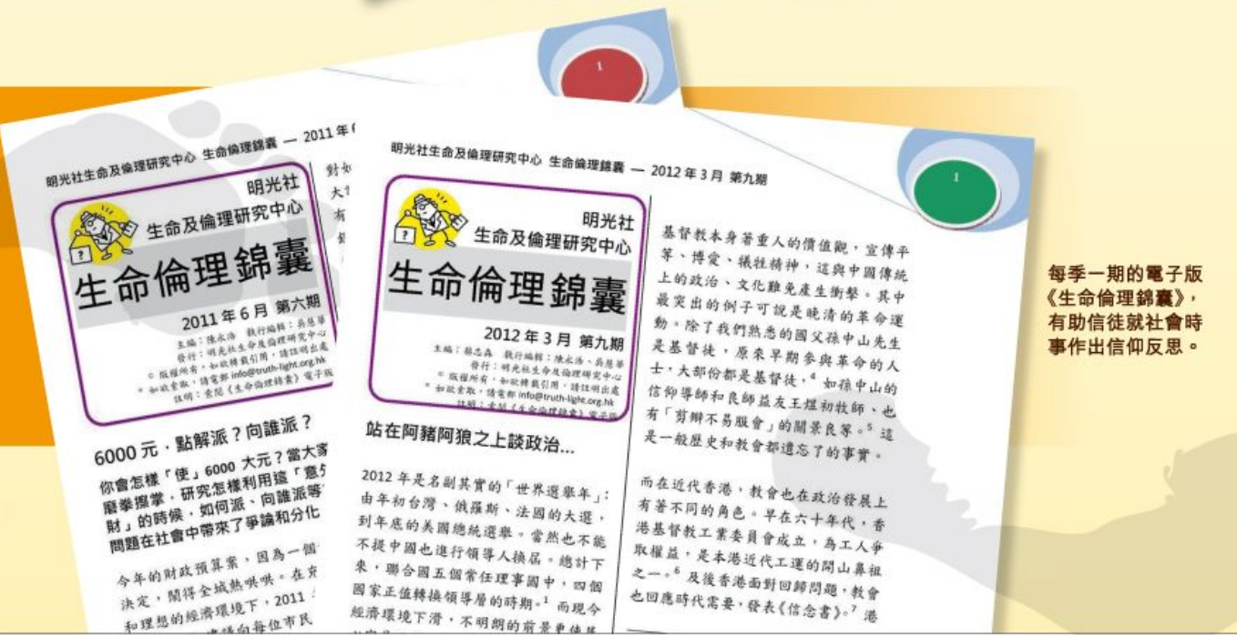
每季一期的電子版《生命倫理錦囊》，有助信徒就社會時事作出信仰反思。