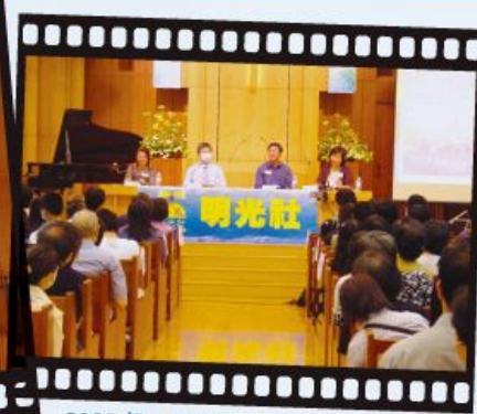
2003 年，明光社以行動關心受非典型肺炎影響的人士及家庭。