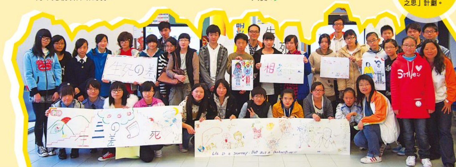
明光社在華永會資助下，於去年尾展開為期半年的「生之頌、死之思」計劃。

我們期望，工作坊只是開始，能幫助同學正視生命的可貴，並以行動繼續在朋輩間散發正能量，成為祝福別人的抗逆大使！