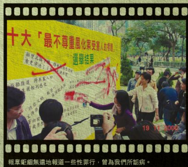
報章鉅細無遺地報道一些性罪行，曾為我們所詬病。

明光社監察傳媒的形象就算不是深入人心，亦早已深入傳媒中人之心，凡是有關傳媒操守的新聞，記者都喜歡找明光社回應，不過，這都是治標的，要真正治本，筆者相信仍須由教育做起，於是，我加入明光社之初，便參與成立傳媒教育協會，並成為創會執委一直至今。此外，又一直努力拓展明光社與學校的關係，為學校提供合適的學生週會或工作坊內容，又為教