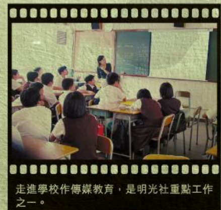
走進學校作傳媒教育，是明光社重點工作之一。