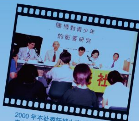
2000 年本社委託城大進行「賭博對香港青少年的影響」調查。