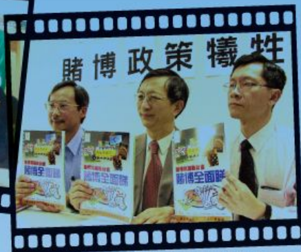
我們向公眾介紹本社所編製的教材套。