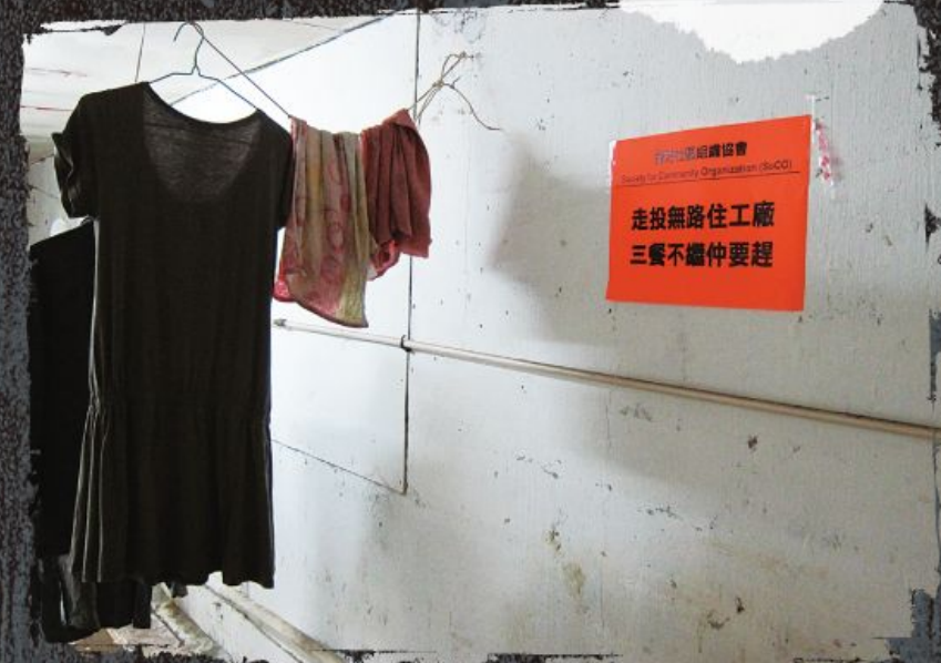
牆上的標語，正是當中 60 多個劏房戶的心聲。

五十年代不少家庭一家七口也擁擠在板間房中，在難民社會，大家習以為常。到了六十年後的今天，香港在已發展國家中高唱是世界最自