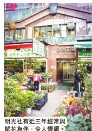
明光社有近三年經常與鮮花為伴，令人懷緬。

2007 年我們再次因業主大幅加租七成而要搬遷，這次我們搬到旺角花墟。不過，每逢新年及中西情人節前數天，同工們實在需要提早出門，並要施展渾身解數及「天龍八步」才能突破花海及人海，成功準時返工。同工返工尚且如此，到來抗議的人士又如何呢？