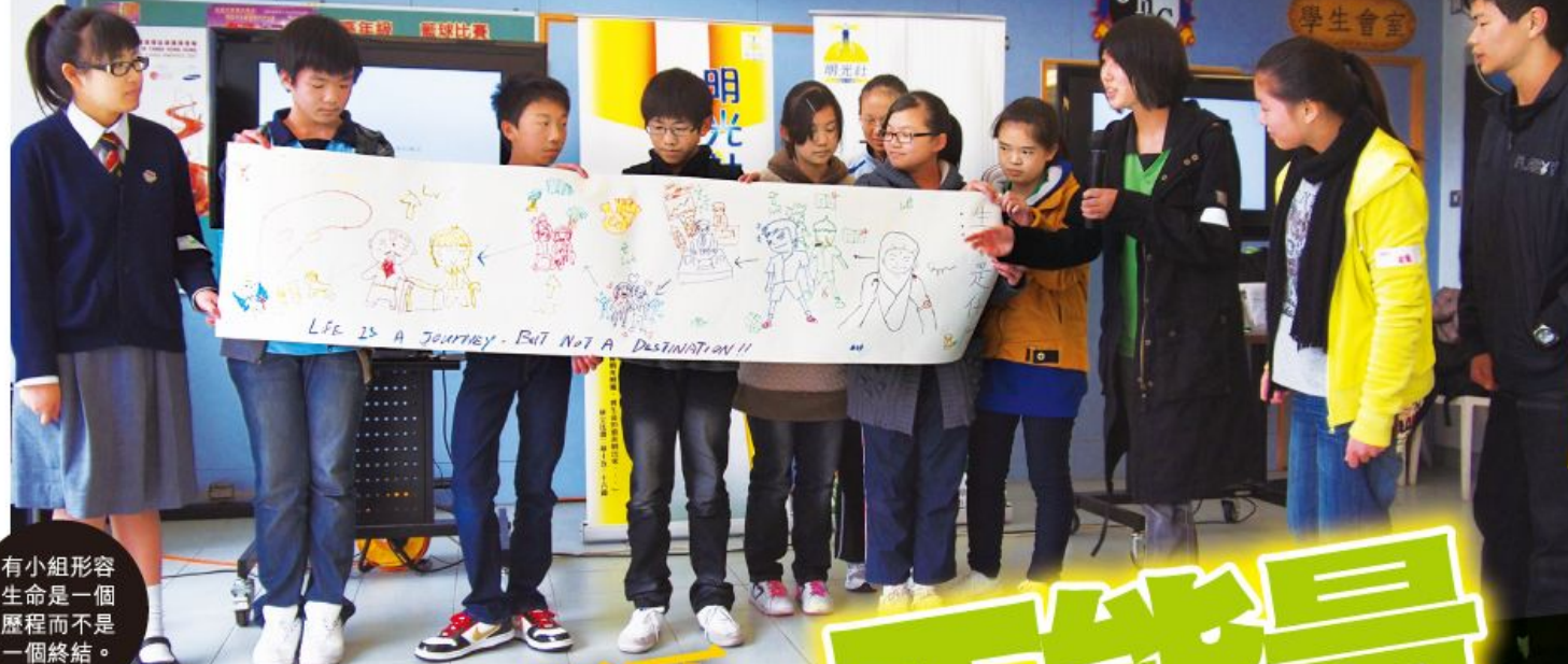
有小組形容生命是一個歷程而不是一個終結。