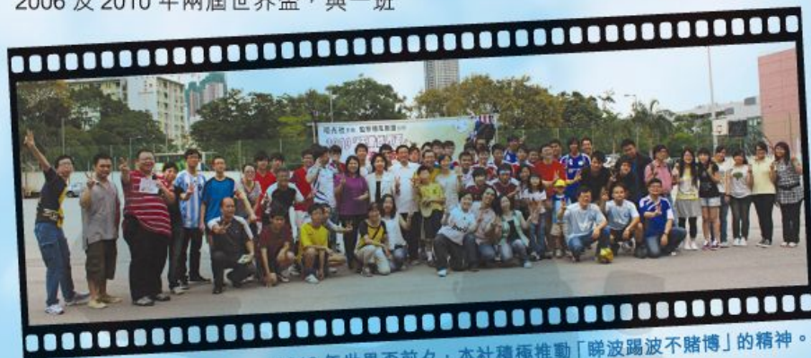
2010 年世界盃前夕，本社積極推動「睇波踢波不賭博」的精神。