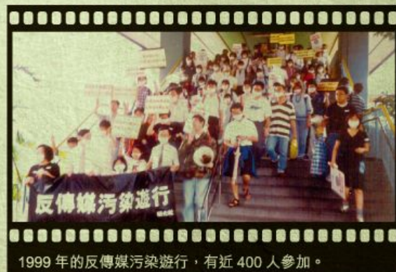
1999 年的反傳媒污染遊行，有近 400 人參加。

之後幾年，明光社多個行動都是衝著傳媒未能履行專業操守而來，包括 2000 年初抗議報章刊登嫖妓指南，當時幾份暢銷報章，每天都刊登嫖妓指