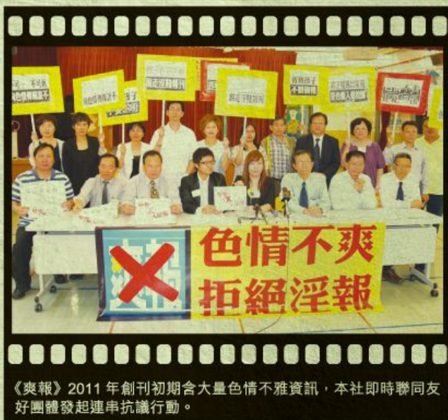
《爽報》2011年創刊初期含大量色情不雅資訊，本社即時聯同友好團體發起連串抗議行動。

要與傳媒共舞，須要的是保持心中那團火，加上專業的知識，對症下藥的策略，以及不屈不撓的毅力。