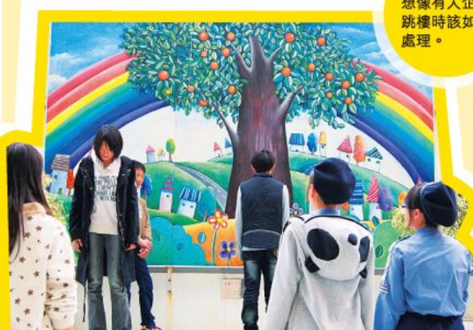
學生透過想像有人企圖跳樓時該如何處理。