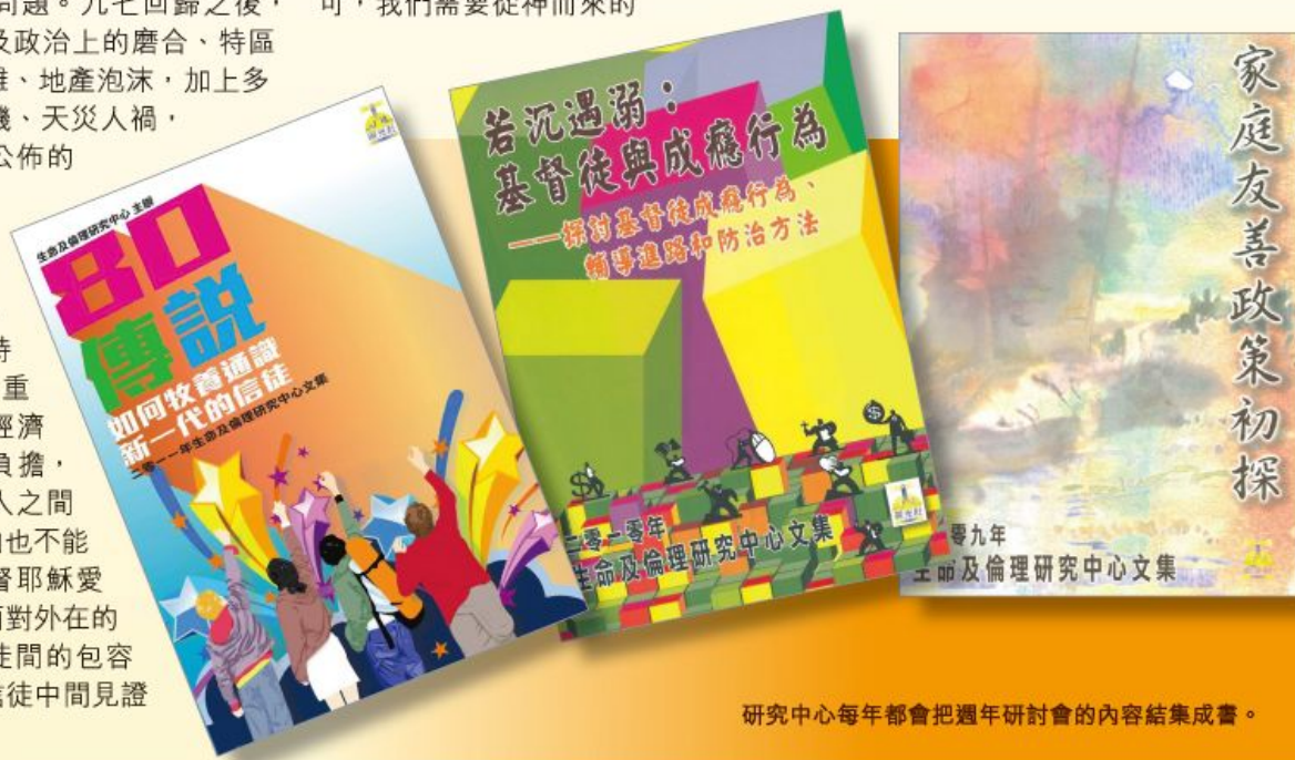
研究中心每年都會把週年研討會的內容結集成書。

另一方面，教會如何關心香港社會的情況？福音如何適切地提供另一種出路，而不是指責或審判陷於罪中的人？無可否認，在倫理及社會問題當中，總有個別不同人的故事，獨特的背景、坎坷的經歷或處境，導致他們選擇了甚至連自己原本也不認同的決定。未來，研究中心必須發揮作用，透過對各式各樣生命及倫理問題的研究，整合信仰作出回應，冀能幫助信徒和教會，一起尋找合乎神心意的出路。