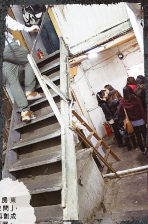
工廈二房東「善用空間」，把五樓再劏成上、下兩層。

及後新聞指二房東在庭上承認只支付 8,800 元租用這些單位。他否認自己違規建築，指 60 個劏房是上一手留下。他又說自己經營公司，租洋松街大廈是用來擺貨、存貨，分租只是以迷你倉形式，給租客作工業用途。事實上，那裡的住戶都非常反感，因為在清拆前的數個星期，他仍然不停向新租戶出租劏房，令不知情者「入局」，這種「你情我願」在資訊極不平衡下，是極之不公道的！