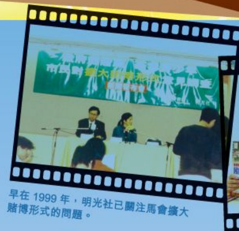
早在 1999 年，明光社已關注馬會擴大賭博形式的問題。

事實上，賭博是一種「窮人稅」：刀仔鋸大樹彷彿提供低下階層「一朝發達」的夢想。而現時報刊體育版已淪為波經版，一些大型賽事往往被塑造成全城矚目、氣氛激烈的盛事。但試想像一下：同是投注 1,000 元，有錢人賭的是閒錢，窮人賭的卻可能是養家的糊口錢。賭博對貧窮人和低下階層的影響其實是大的，是不公義的。