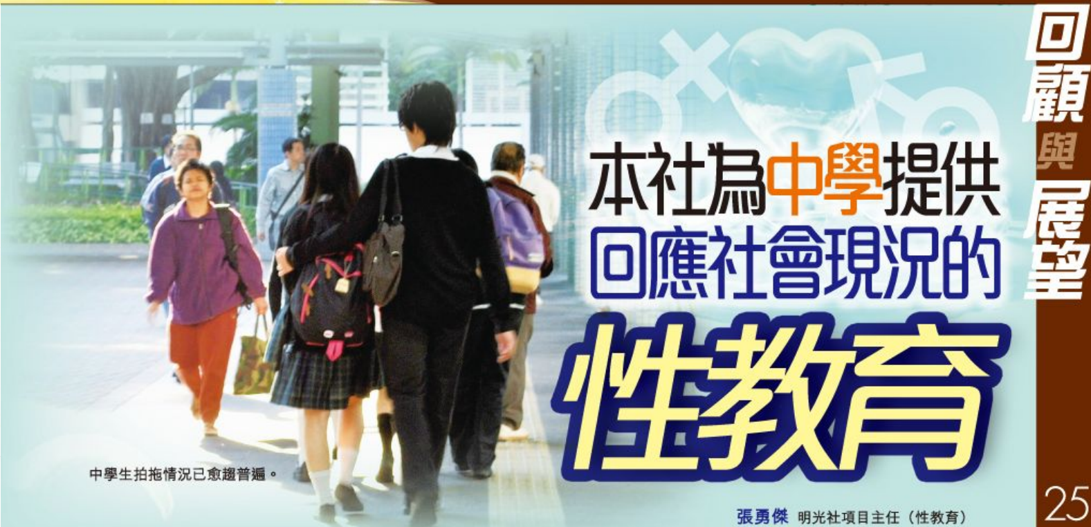
中學生拍拖情況已愈趨普遍。