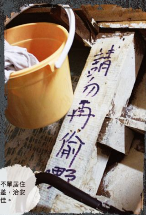
劏房不單居住環境差，治安也欠佳。

由的經濟體系，人人投身金融地產界賺快錢，政府暗暗歌頌實地帶來的收益。同時，愈來愈多中產向下流，連基本住屋都買不起甚至租不起；劏房、板房及籠屋需求和租金都不斷暴升；更有露宿者因附近豪宅居民投訴而被狠狠驅散。病徵四起，四面楚歌！