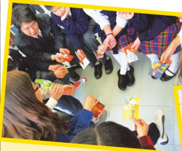
同學嘗試以遊戲卡來描繪對死亡的感覺。