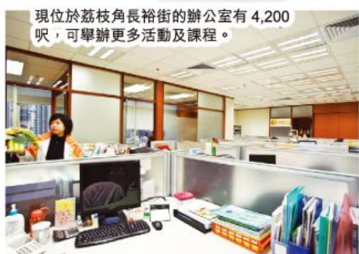
現位於荔枝角長裕街的辦公室有 4,200 呎，可舉辦更多活動及課程。

去年，我們因地方不敷應用，再以「換樓」方式購入了現在荔枝角長裕街的會址。在可見的未來，我們應不須要再為搬辦公室而煩惱，可以更專注於事工的發展，但我們的工作如果缺乏弟兄姊妹及教會的參與，也是徒然。事實上，我們寫的文章、製作的教案、舉辦的活動，全都需要您的支持及參與。誠邀您與我們同行，一起見證神如何透過我們的工作改變文化、影響生命！