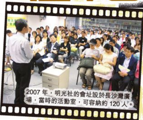
2007 年，明光社的會址設於長沙灣廣場，當時的活動室，可容納約 120 人。

猶記得 2009 年有一批人由荔枝角恩福堂遊行到我們位於花墟的辦公室抗議我們對淫審和家暴條例的意見，當他們抵達花墟時，不知甚麼緣故，竟找不到辦公室的位置。事實上，遊行隊伍當中有部份人士在 2008 年也曾前來抗議，他們在附近徘徊一段時間後，仍找不到，唯有在叫叫口號後宣佈遊行結束。未知是因為花墟太多花令他們眼花繚亂？我們的辦公室太細難以尋找？抑或……，總之，感謝神的保守。