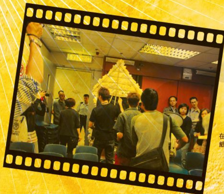
在 2011 年，同運團體拿著紙花牌衝擊本社辦公室。

未來，面對變性人婚姻的爭議；同性婚姻及同性伴侶法；同性戀運動在中小學及大學的滲透，深願有更多教會及信徒為保護我們的鄰舍及下一代多出一分力，與我們一同回應廿一世紀最大的挑戰——性革命。