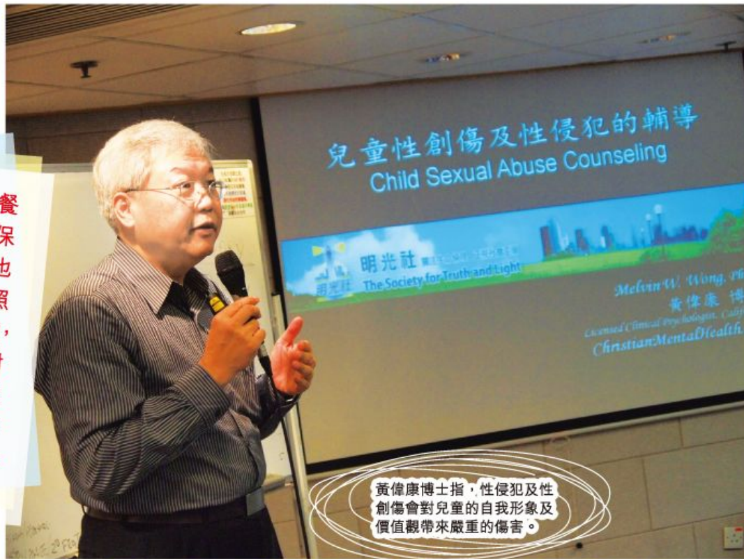
兒童性創傷及性侵犯的輔導 Child Sexual Abuse Counseling

想孩子茁壯成長，除了提供三餐溫飽、優秀的教育外，好好保護他們的身體免受性侵犯，也同樣重要。正如美國加州執照臨床心理學家黃偉康博士所指，兒童及青少年時期的經歷，對人的一生成有深遠的影響，而性侵犯及性創傷對兒童的自我形象及價值觀更帶來嚴重的傷害，不能小覷。