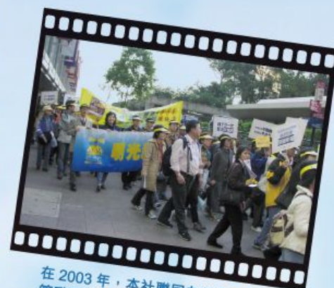
在 2003 年，本社聯同友好團體策動反對賭波合法化大遊行。