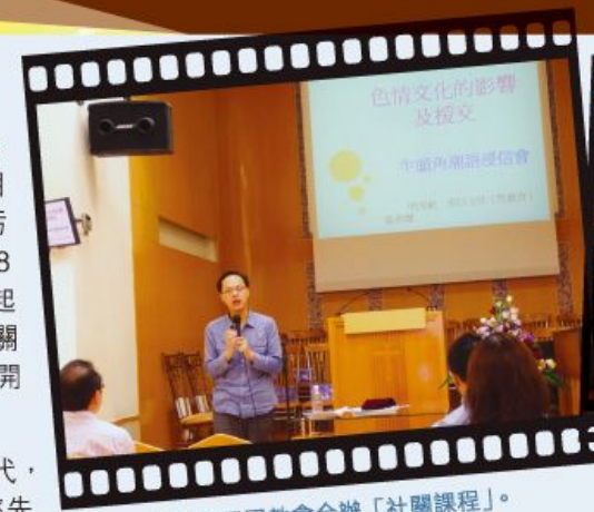
本社與不同教會合辦「社關課程」。

當然，明光社並不只關心傳媒發展的。作為一個關心社會發展的機構，我們多年來亦積極回應多項社會事件和議題。就如在賭博問題上，明光社以及其他關注賭風團體早在 1999 年已對馬會積極的賭博營運手法作出抗議行動，隨後在 2003 年積極參與反對賭波合法