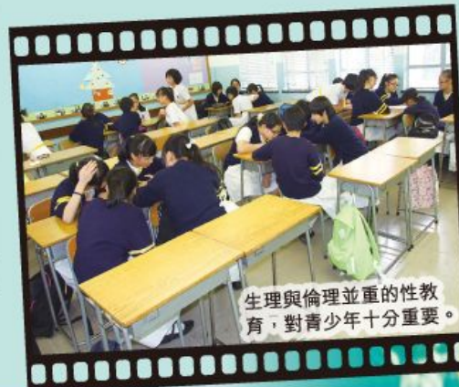
生理與倫理並重的性教育，對青少年十分重要。

在第一年的先導計劃中，我們派出同工進入課室為 14 所學校進行了 109 場性教育工作坊，主題包括男女性別角色、色情文化、婚前性行為、戀愛懷孕、婚姻與家庭、同性戀等不同題目。學生反應理想，校方回應正面。