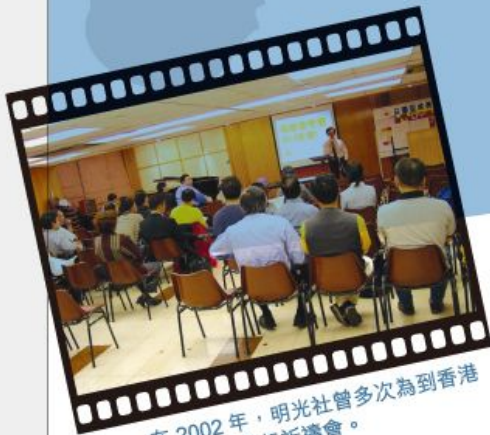
在 2002 年，明光社曾多次為到香港社會風氣發起祈禱會。