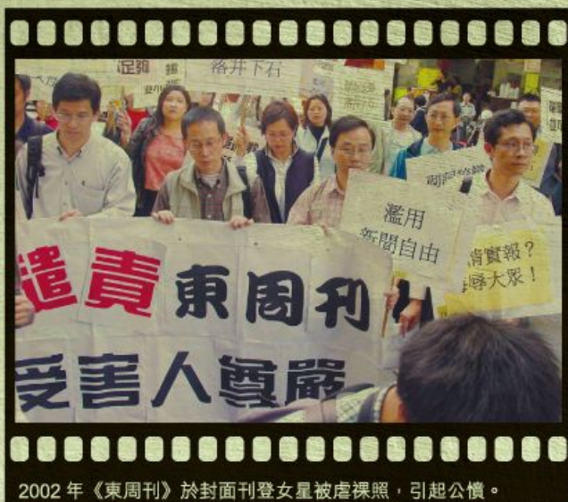
2002年《東周刊》於封面刊登女星被虐裸照，引起公憤。

師和家長提供訓練，協助大家培養健康的傳媒素養，因為不懂得分辨和欣賞何謂優良的傳媒，又豈能或豈願摒棄不良的傳媒呢？