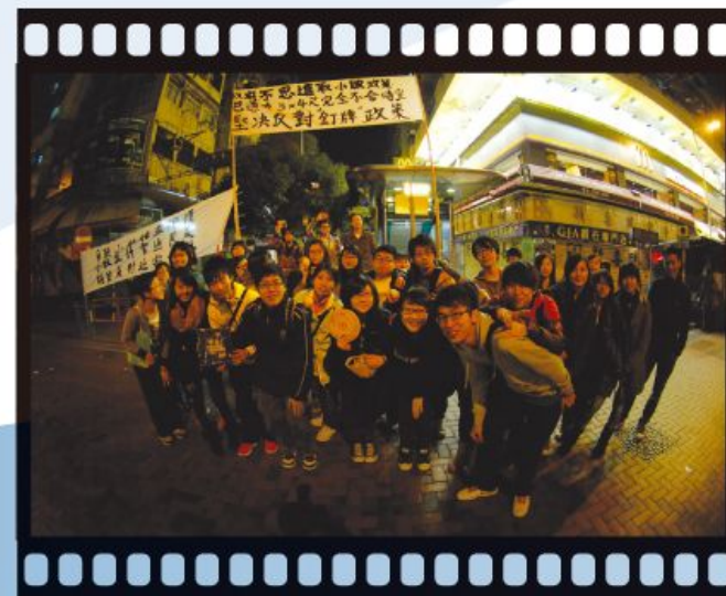
2011 年尾我們首次舉辦青年社關領袖訓練營，鼓勵年青人關心社會。