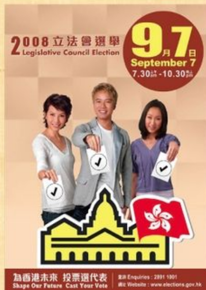
為香港未來 投票選代表 Shape Our Future Cast Your Vote 如何才是理想的立法會組成模式，不同人有不同答案。

基督教信仰如通識學科一樣，強調立場背後的動機、價值觀。當基督徒遇上通識學科中不同的價值觀，我們就必須對信仰有更多的認識，這肯定能為我們提供更多理據和思考，使我們更能以基督教的立場，回應日新月異的社會議題。想知更多，請留意生命及倫理研究中心第 14 期的《生命倫理》有關資深通識科老師許承恩的分享吧！