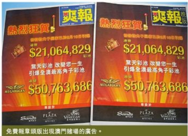
免費報章頭版出現澳門賭場的廣告。

香港政府常常以言論自由和新聞自由為理由，拒絕監管有關廣告，這是完全沒有理據的。綜觀不少歐洲國家，都有法例去規管賭業，而在規管的同時，亦對外來賭業的宣傳加以禁止，例如英國，是非常嚴厲地禁止離岸賭場，或者離岸的樂透(即六合彩)廣告。香港不是應該效法嗎？否則香港人表面上沒有在香港沉迷賭博，但實際上是轉到澳門去，這豈不是失去了原本香港不鼓勵賭博的意義？