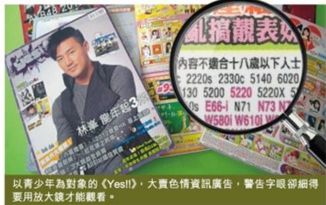
以青少年為對象的《Yes!!》，大賣色情資訊廣告，警告字眼卻細得要用放大鏡才能觀看。

見微知著，媒體理應關注受眾是否接收到合宜的資訊，這是一種對社會的責任和承擔。作為雜誌負責人，《Yes!!》的管理層本可要求廣告商提出修改，可是他們對廣告商發佈對青少年百害而無一利的廣告資訊完全置若罔聞，這充分反映《Yes!!》根本沒有對青少年作出真正的承擔。