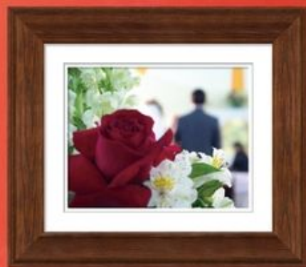
時代愈來愈開放，由男女婚姻所衍生的家庭人倫關係快將被瓦解。