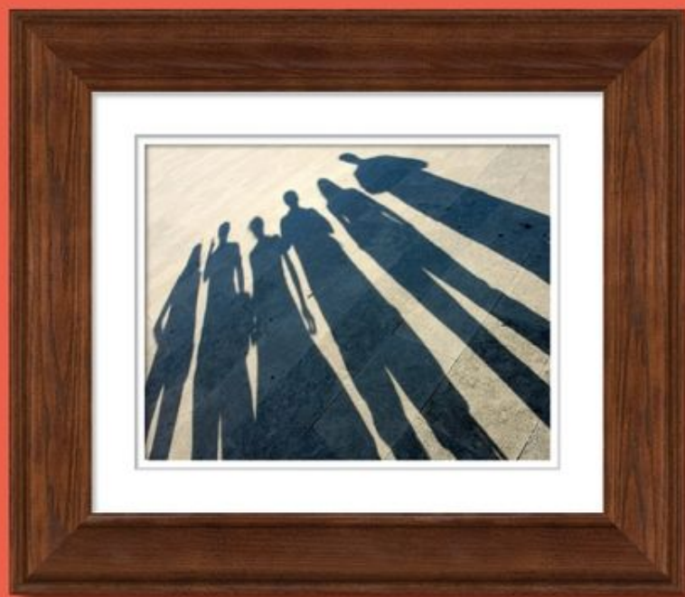
台灣伴侶盟主張「三五好友」也可組成家庭。

多元家庭觀念是近年全世界的熱門話題，台灣最近也為此而鬧得熱哄哄，並為「家庭」重新再定義。在這種文化洪流下，互古以來由男女婚姻所衍生的家庭人倫關係將徹底被瓦解。