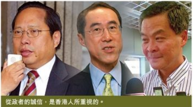
從政者的誠信，是香港人所重視的。

特首選舉快將過去，但立法會選舉將至，但願大家都有智慧，分辨誰在睜眼說謊言，誰在努力做符合事實的誤導之辭，而大家又不被誤導，並尊重那些小心說話的誠實人。