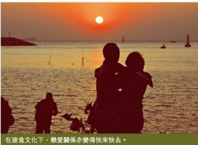
在速食文化下，戀愛關係亦變得快來快去。

身體是屬於我們自己的，我們的確有權決定過自己喜歡的生活模式，但這種輕視身體價值的行為對我們真的有益嗎？