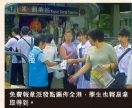
免費報章派發點遍佈全港，學生也輕易拿取得到。

香港現時主要有五份免費中文報章，每日發行量達300萬份。由於競爭激烈，各報老闆也會出盡渾身解數，吸引讀者的注意。由於免費中文報章印刷量龐大，其派發地點遍佈港九新界，大多是在熙來攘往之地點（如鐵路站和私人屋苑等），清早便上學的學生非常容易取得，有些報章為求刺激讀者眼