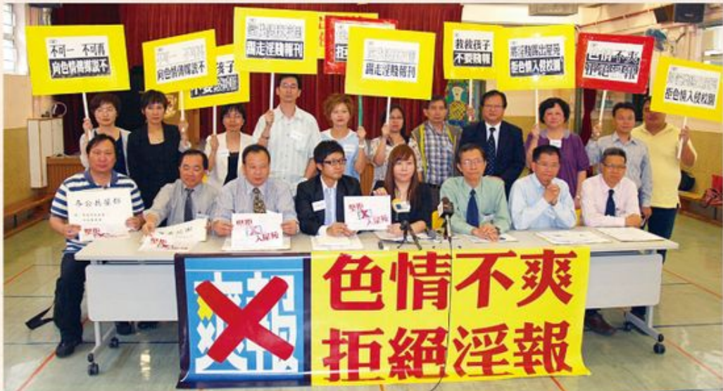
明光社在《爽報》創刊後的第四天，聯同了多個教育界、社工界、家長組織以及關注青少年成長團體舉行「色情不爽 拒絕淫報 救救孩子」記者招待會，譴責該報荼毒青少年。

打擊廣告及分銷途徑 免費報章的唯一收入來源是廣告，於是，我們鏗而不捨地去信一些曾在該報刊登廣告的客戶，提醒他們該報已多次被評為不雅，並已有百多個團體和一千多個個人聯署譴責，希望他