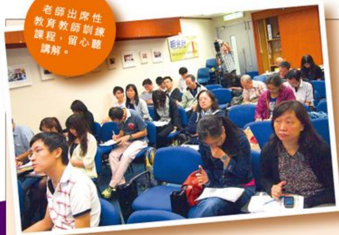
老師出席性教育教師訓練課程，留心聽講解。

人，但近三至五年的文獻卻發現多了一些十多歲的少年人和60至70歲的長者。而性沉溺與性罪行也有一定的關係，約55%性罪犯患有性沉溺，兒童性侵犯者患有性沉溺的更高達71%。