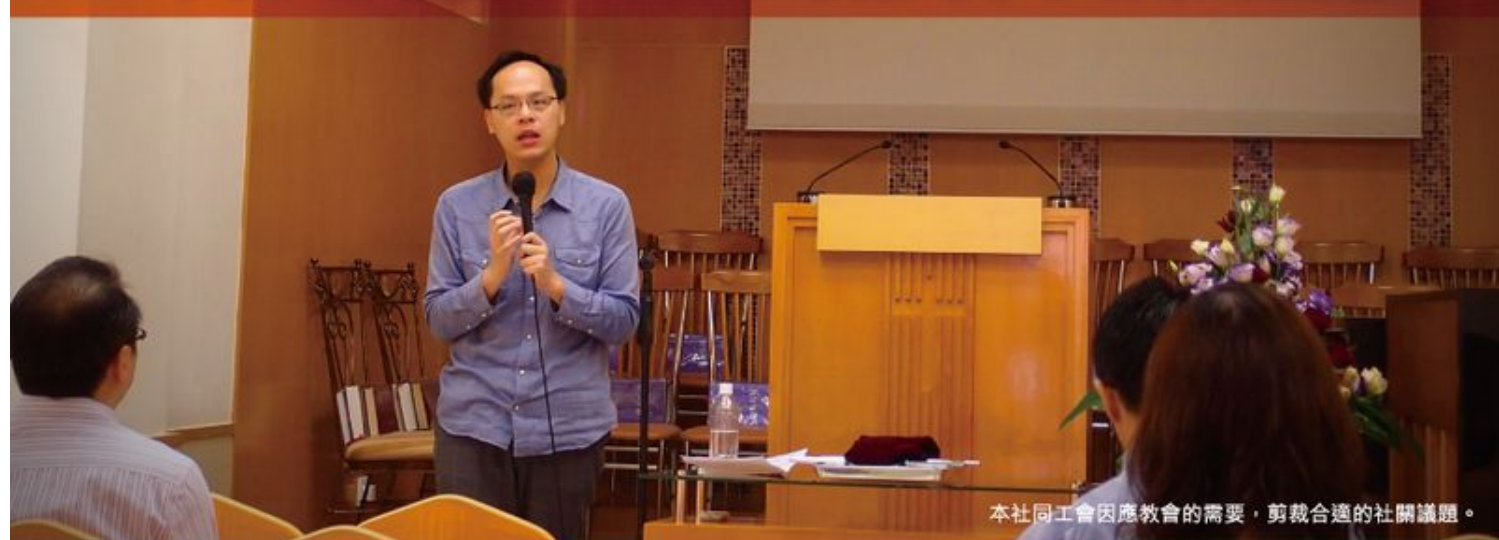
本社同工會因應教會的需要，剪裁合適的社關議題。

千里之行，始於足下。要成為關心社會的教會，就先要明白今日社會的各種現象，以致教會能在社會中，不止持守真理，也能將信仰踐行。從前年開始，明光社與不同的教會合辦「社關課程」，先後與港島東區、南區、青衣、大埔等地區的教會合作。在今年秋季，明光社與牛頭角區的一間教會合辦了新一期的「社關課程」，與信徒們分享：關心社會，其實不難！