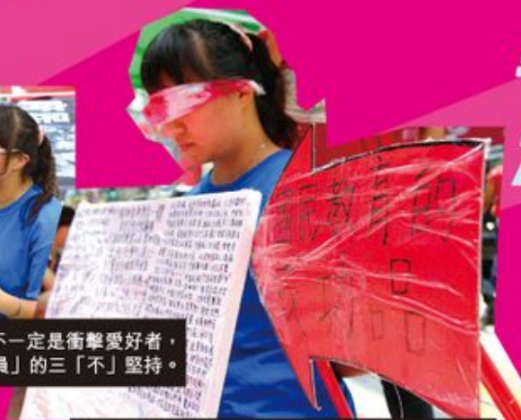
這是曉晴口中所說自己最激烈的一次抗爭行動。