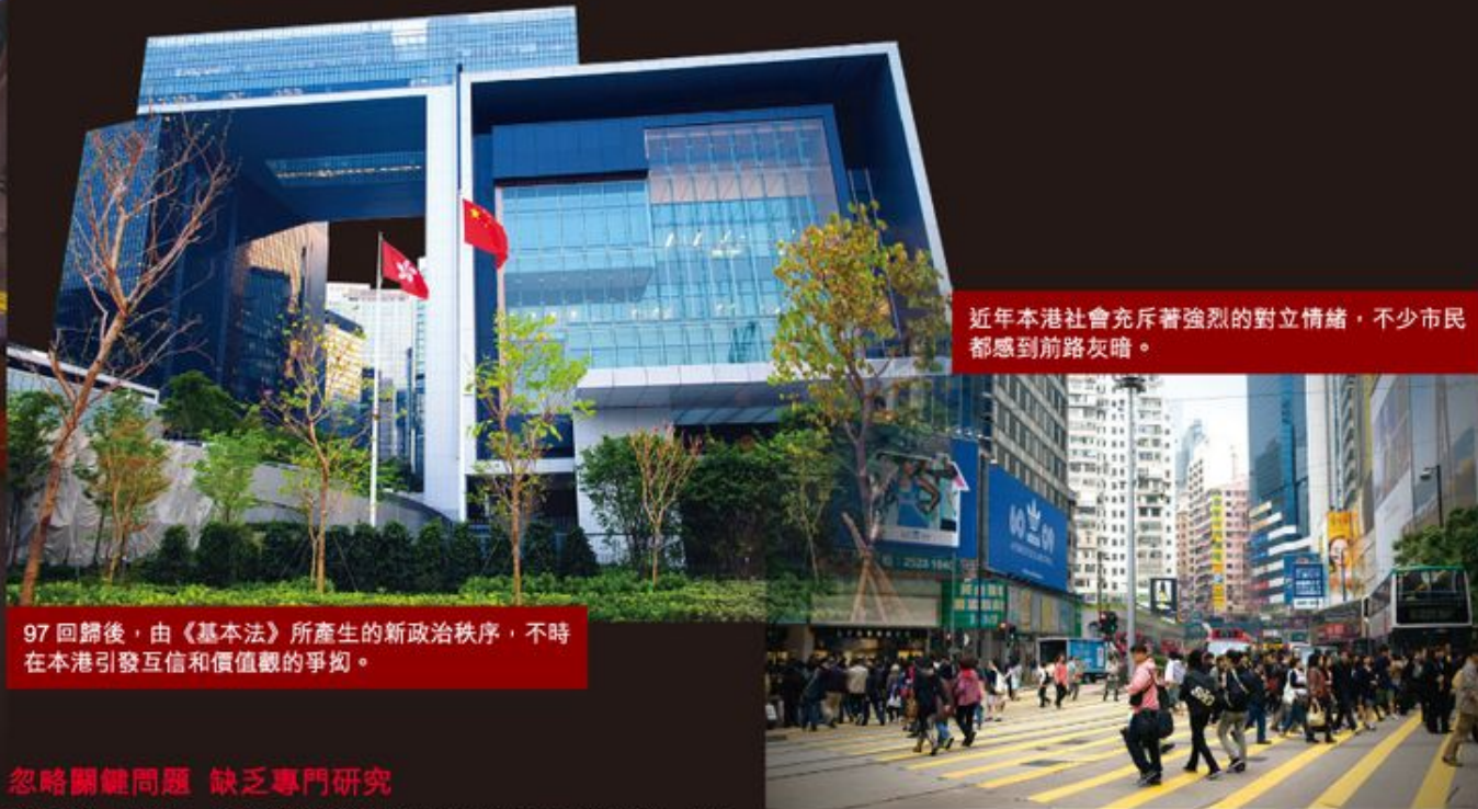
97 回歸後，由《基本法》所產生的新政治秩序，不時在本港引發互信和價值觀的爭拗。

在 1997 年以前，我們擁有的，是一個由英國管治的香港政府，可是，自 1997 年回歸後，我們即時變為「港人治港」，這個轉變是來得很急促的。英國官員一夜撤走了，政府數百個空缺我們可以填補，但很多政策知識、政治判斷，我們的香港官員卻無法跟上，以致對於社會問題，回應乏力。基於在政治、經濟轉型過程中所產生的張力、矛盾未能解決，那便具體反映在政策的爭執，或價值的爭拗上，因而形成了今天社會愈走愈極化的局面。