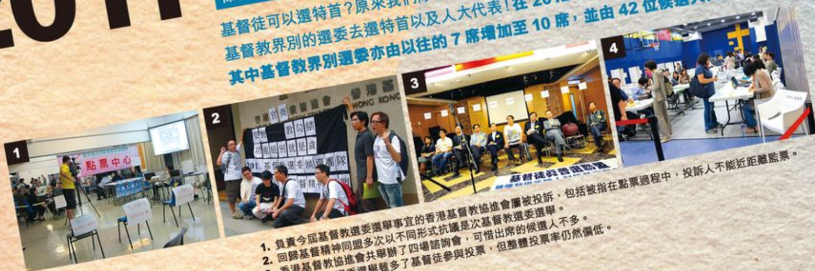
1. 負責今屆基督教選委選舉事宜的香港基督教協進會被投訴，包括被指在點票過程中，投訴人不能近距離監票。 2. 回歸基督精神同盟多次以不同形式抗議是次基督教選委選舉。 3. 香港基督教協進會共舉辦了四場諮詢會，可惜出席的候選人不多。 4. 今屆基督教選委選舉雖多了基督徒參與投票，但整體投票率仍然偏低。

基督徒可以選特首？原來我們除了享有一般公民權利可選出立法會議員外，還可以用「基督徒」身份選出基督教界別的選委去選特首以及人大代表！在2012年特首選選中，選委會委員擴充至1,200名，其中基督教界別選委亦由以往的7席增加至10席，並由42位候選人角逐席位。