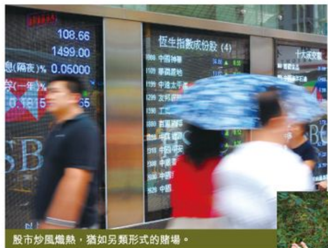
股市炒風熾熱，猶如另類形式的賭場。

不公平的市場，加上不成比例的衍生工具，造就現在凡股皆賭的惡果。不少財經報章更形容情況和「買大細」沒有分別，根本就沒有技術分析可言。政府雖然曾表示成立委員會討論有關的監管制度，但至今仍然只聞樓梯響。香港的賭風不獨由馬會帶起，如果股市變成純粹的大賭場，後果更不堪設想。