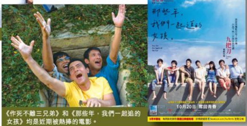
《作死不離三兄弟》和《那些年，我們一起追的女孩》均是近期被熱捧的電影。

你還讓自己的夢因在電影中？快回到現實，為自己編一部屬於自己的《那些年，作死不離三兄弟》吧！