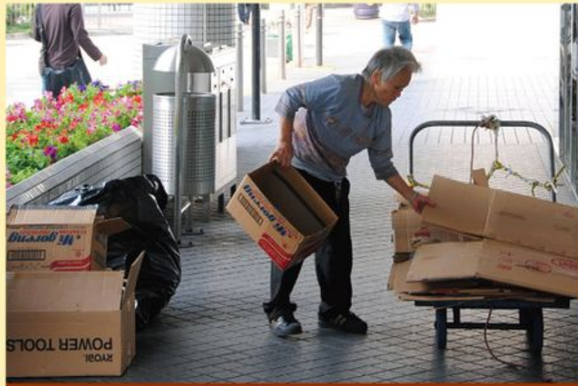
社會充斥著各種的不公義，教會不應視而不見。

信徒方面，我們在舉辦了幾次課程後，最多的回應，就是學員對自身信仰的反思：信仰不再只是「聖經裡的東西」，而是我們生活的一部份。除了明白真道，更要行出真理。關心社會，成為很多學員們完成課程後，踐行信仰的新目標。