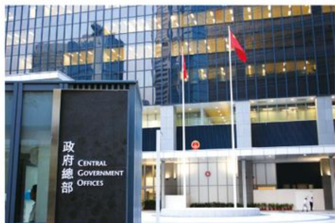
政府新聞處被揭發向傳媒發放合成照，公信力備受質疑。