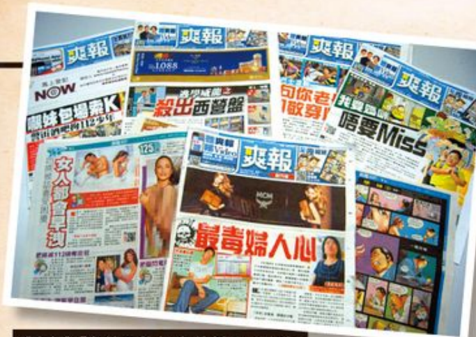
《爽報》「無性不歡」，無論新聞、副刊、小說、漫畫、天氣以至通勝都大灑鹽花。

其廣告客戶的人士採取法律行動，當然，在會面的時候，他們表示心目中已猜到那些人會上門或懂得直接致電負責處理廣告事宜的負責人，他們會「做嘢」。而我們亦清楚表明，在公民社會，透過發信呼籲一些廣告客戶不要支持某些違反公眾利益的行為是十分正常的，如環保團體、反對吃魚翅或穿皮草的團體便經常發出類似呼籲。我們亦不認為發信及以電話跟進對方是否收到信是滋擾行為。因此，只要我們發現《爽報》繼續有一些出位的色情暴力內容，會繼續發信予其廣告客戶。而呼籲學校禁止學生攜帶、屋苑不要派發的聯署仍然會繼續留在我們的網頁，直至我們有理由相信《爽報》已作出方針和風格上的實質改變。