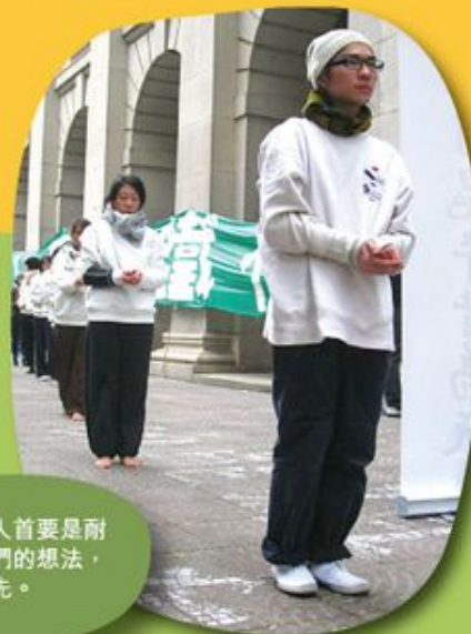
牧養年青人首要是耐心聆聽他們的想法，以關係為先。

陳牧師又稱，在多數情況下，教牧不須要提供對社會議題的立場，但必須為信徒互相包容而祈禱，並保持溝通的渠道暢順。說到底，陳牧師指出，信徒必須明白和接受教會在神國度計劃中的身份、互為團契的本質和神所頒佈的使命，才有基礎團結更多的人，在社會參與中產生正面的影響力。