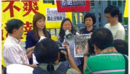
明光社代表亦曾聯同多個家長組織以及關注青少年成長團體前往壹傳媒廠房進行抗議。

另一個影響免費報章收入來源的方法是打擊它的分銷途徑和增加其分銷成本，為免每天一早出門的中小學生在其大廈地下大堂、屋苑範圍或學校附