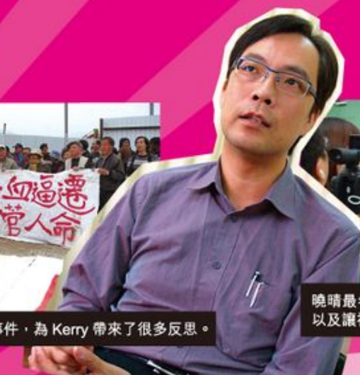
Kerry 鼓勵基督徒可以透過非暴力手法，參與社會行動。