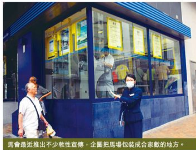
馬會最近推出不少軟性宣傳,企圖把馬場包裝成合家歡的地方。

從以上舉措看來,民間團體必須要留意馬會會否靜靜起革命,乘澳門賭場把賭博年齡提升至21歲之際,千方百計吸引18-21歲的港澳青少年回流到香港下注。