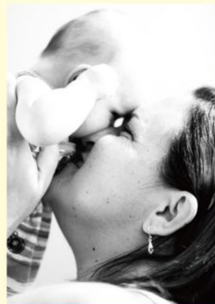
研究顯示，母親對子女的成长是最重要的。

作為仿效的男性對象，兒子習慣在女性圈子中生活，男子氣概未能發展完成，自己的感情和情緒發展的模式亦變得女性化，容易產生性屬身份混亂。此外，若夫妻的關係欠佳，母親亦會缺乏安全感，唯有轉向從兒子身上填補心靈上的空缺，或會過分呵護兒子而不願放手，使兒子錯失建立男子氣概的機會。