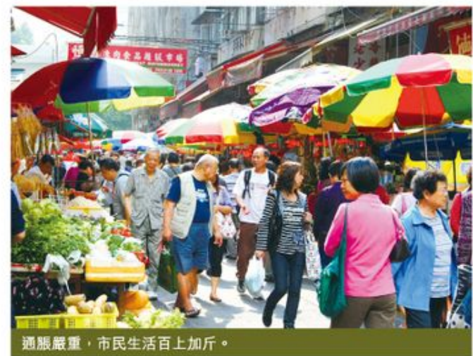
通脹嚴重,市民生活百上加斤。

其實這些不同的計劃、減價,只是商人透過「修辭」技巧,給你心理上很便宜的感覺。長此下去,誠實商人難以營商,無知的消費者卻助長了大集團繼續膨脹。最後,是誰得益呢?