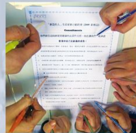
組員共同簽訂約章，承諾委身於個人及小組成員的成長。