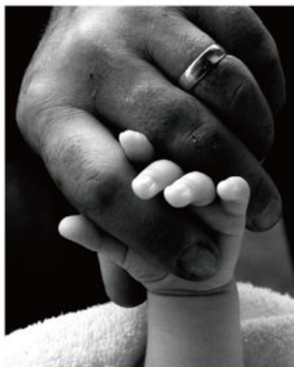
每個人一出生就應具有與生俱來的天生性屬身份取向。

在男孩子的情況，兒子與母親分離過程成功後，若在試圖依附父親時被拒絕而受到傷害，又或者因不同的緣故父親不在兒子身邊，兒子因未能與父親建立依附關係，情感上出現孤兒心態，引發防衛性心理過分依附 (Defensive Attachment)，為免遭到更多打擊，只好在母親身上建立依附關係來獲取安全感。若周遭並沒有可