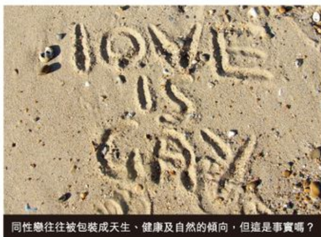
同性戀往往被包裝成天生、健康及自然的傾向，但這是事實嗎？

當大家以為事情已暫告一段落時，外國有同性戀者於 8 月 7 日於香港經濟貿易辦事處駐紐約辦事處外抗議香港社署的決定，務求要全球封殺新造的人協會，在如此短時間，能夠動員這麼多人發動電郵攻勢，您還相信同性戀團體真的是弱勢社群嗎？就算她們過往真的受過一些不公平的對待，但她們對一些弱勢中的弱勢（即想尋求改變的同性戀者）的態度亦令人不敢恭維！多元社會除了不想改變的同性戀者之外，難道沒有想改變的同性戀者？