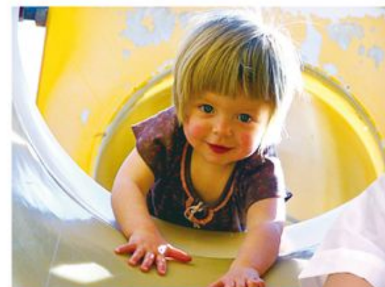
男孩的男子氣概和女孩的女性氣質，都需要適當地建立。