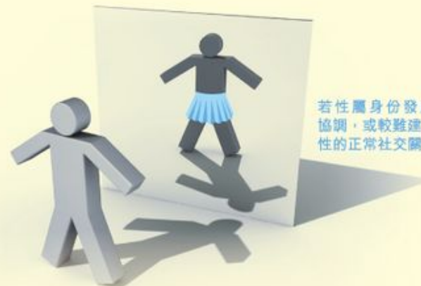
若性屬身份發展不協調，或較難建立同性的正常社交關係。

至於有關性別中立 (Gender Neutrality) 的說法，黃博士坦言並不認同，他認為人一出生就有一種與生俱來的天生性屬身份取向，男性希望發展出男子氣概，女性希望發展出女性氣質。若在成長過程中性屬身份發展不協調的話，會覺得自己與其他人有分別，容易出現情緒波動、緊張、