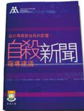
香港大學曾出版有關自殺新聞報導建議的小冊子。

《蘋果日報》在今年8月16日頭版以「中大迎新營玩死女生 作家之女留遺書跳樓亡」為標題，報道一名中大女學生在參加迎新營後自殺， 1 並稱其自殺原因是「在迎新營時感到『好辛苦』及『好唔開心』」，亦稱其家人亦覺得該女生自迎新營回家後很不開心。有關標題明顯是在沒有證據之下，硬將女生輕生事件和中大迎新營扯上關係。及後，中文大學新生輔導營籌委會致函予記者協會及香港報業評議會，投訴該報道毫無事實根據和「斷章取義」，並呼籲學生罷看該報。 2