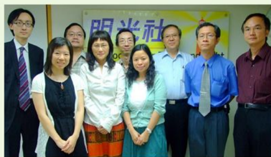
明光社生命及倫理研究中心諮議小組於2008年9月11日會議留影。

但願在大家的支持下，研究中心可以果實纍纍，有高水準的研究成果，從而推動他人關心社會上的生命及倫理問題。🍎