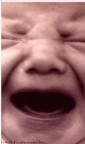
J-edell Productions Inc.

因為選擇本身是空洞的，Pro-choice是把選擇權歸還給婦女，但如何使用這權利是有好壞之分的，所以在墮胎的議題上把選擇權歸還婦女後，我們要勸她在選擇上應當要尊重生命（Respect human life in your choice）!