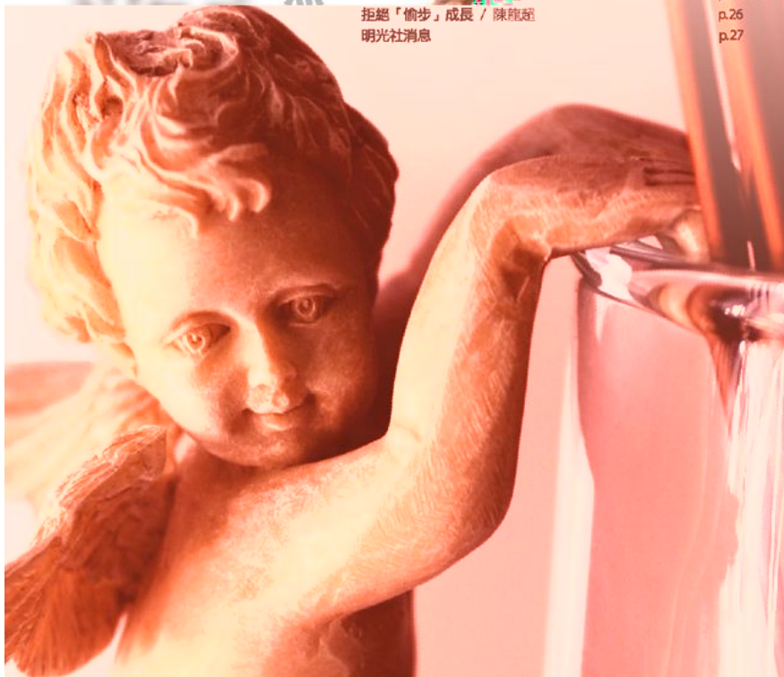
拒絕「偷步」成長 / 陳龍超 明光社消息