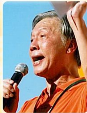
分享嘉賓：朱耀明牧師 2007/12/28(星期五)