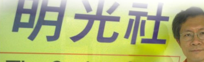
明光社 The Society for Truth and Light