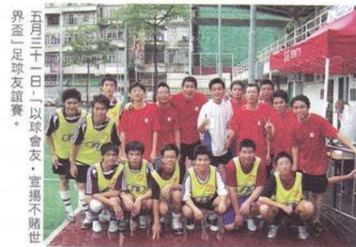
五月三十一日「以球會友·宣揚不賭世」足球友誼賽。

在監察賭風聯盟首個研究香港問題賭博社會成本的調查裡，我們發現香港賭徒經常參與的賭博活動，超過六成是合法賭馬，而合法賭波就幾近四成。累積起他們拖累家人和親友的數額，以及政府為他們付出的開支（如醫療、輔導、罪行調查等），馬會每繳納1元的博彩稅，社會就得付上接近9元的成本來善後，故此，我們將繼續聯繫戒賭機構，關注本港問題賭博的發展。