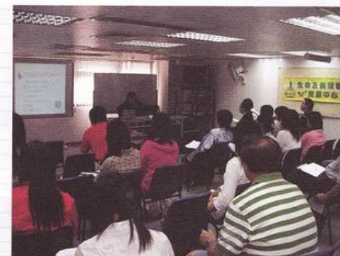
10月21日 - 葉淑芬律師講解有關歧視法及性傾向歧視條例的資料

在兩名講員分享完畢後，再由本社性文化項目主任陳碧珊小姐示範如何使用此教材套，希望讓參加此兩次聚會的老師、導師了解此教材套的使用方法。我們更期望此教材套真的能夠在老師、導師手上發揮功效，幫助青少年對此議題有更全面和健康的認識，亦能夠達到平衡社會現時頗為一面倒 - 大部分有關同性戀的教材和資料都有失實之嫌 - 的情況。 ●