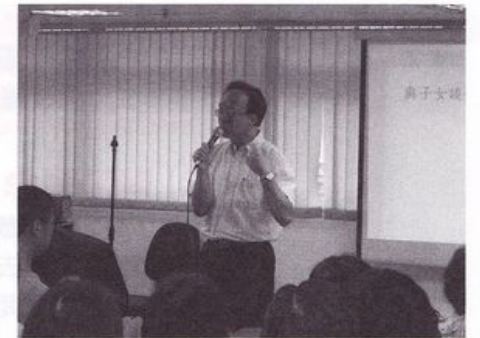
李錦洪社長：家長在性教育的優勢是所謂的專家沒有的，但需多動腦筋多花心思去解決問題

在聚會下半段，雖然特別預留了大半小時的答問時間，看來仍不能滿足眾家長的需求，但因時間有限，我們並不能讓每位家長