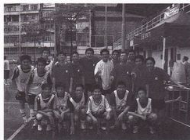
『不賭世界盃』足球比賽

有什麼原因推使40位素未謀面的中學生，參加明光社舉辦的體育記者訓練班，參與製作《06世界盃特刊》？可知道出版及製作一本特刊所經歷的苦與樂嗎？