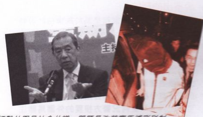
打擊外圍是社會共識，問題是改革賽馬博彩稅制與打擊外圍有多大關係呢？