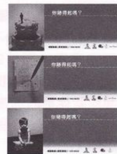
三款『你賭得起嗎』橫額