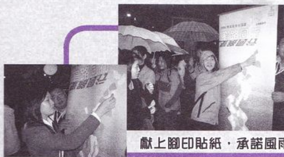
獻上腳印貼紙，承諾風雨同路