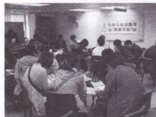
體育記者認真地閱讀 資料，為分組匯報作 準備