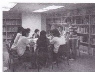
體育記者與設計師開 會，構思設計概念