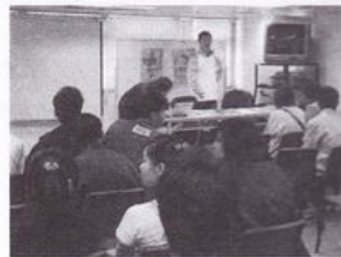
導師向同學講解製作 世杯特刊的詳情