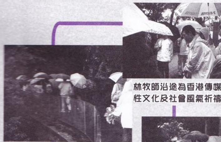
林牧師沿途為香港傳媒、性文化及社會風氣祈禱