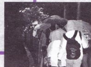
風雨不減步行者的士氣