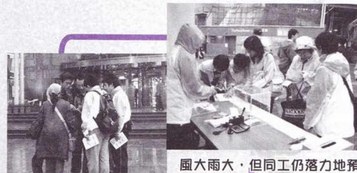
風大雨大，但同工仍落地地預備

全段路程約需一小時，大家一起於風中、霧中、雨中及狼狽中完成整個行程，途中亦不忘為香港的傳媒、性文化及社會風氣守望祈禱。更有弟兄姊妹無懼風雨帶同年幼的子女出席，令我們非常感動，在此，再次多謝大家的支持。