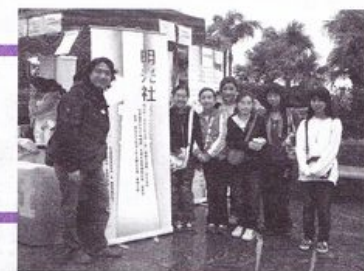
小童群益會義工支持