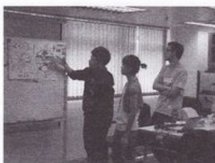
同學匯報廣告設計的 理念