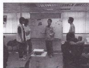
分組活動後，同學匯 報討論結果