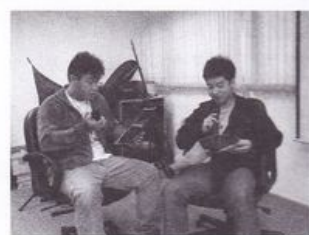
體育記者模擬球星接 受訪問的情況