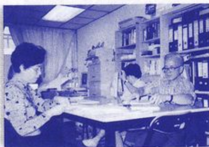
* 當時徐姊妹主要是負責包裝《燭光網絡》，以及一些庶務工作。